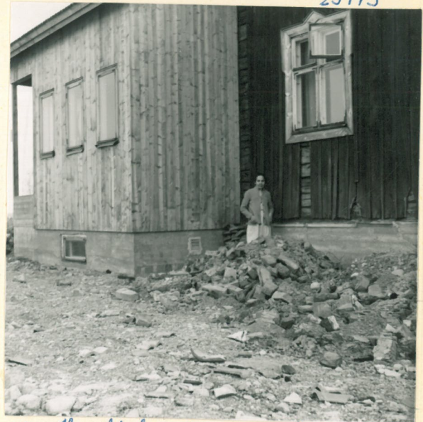
Onv. Heinikkalan sisar seisoo Lp:n vieressä. Lp. on kivijalan alla.