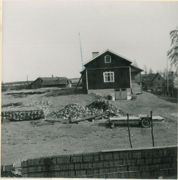
Untamalan Heinikkalan kuvattuna Untamalan kirkonmaan laicalta. Lp. on muuten osittamalla kohdalla.