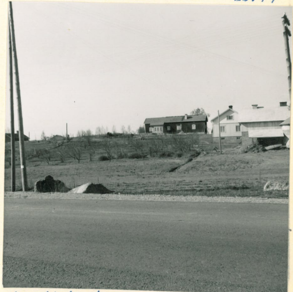
Heinikkala kuvattuna Turku - Rauma tie- linjalta. Eoilan rakennuksia näkyvä vasemmalla. Untamalan kirkko ja oikealle.