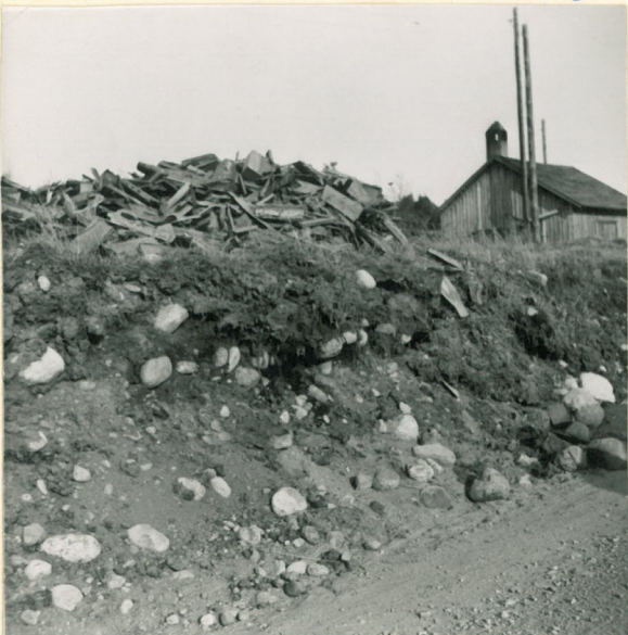
Untamala Myllymäki. Mahdollisesti jo tutkitun polttohaudan mokinon profiili. Kalmiss- toharjun vanhaa tienpuoleista hienettä ruohotään jatkuvasti joko hiekkakotossa tai jossain muussa tyhteydessä. Muinaismuistokivelle on kasattua kuidin kappaleita ym. roskaa.