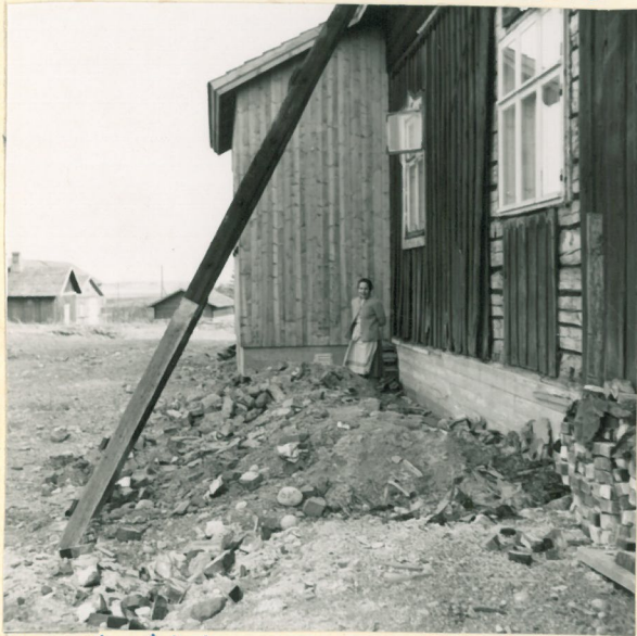
Ks. ed. tekstiä.