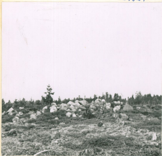
Laitila, Kodjalan takametsä, hautaraunio 274.