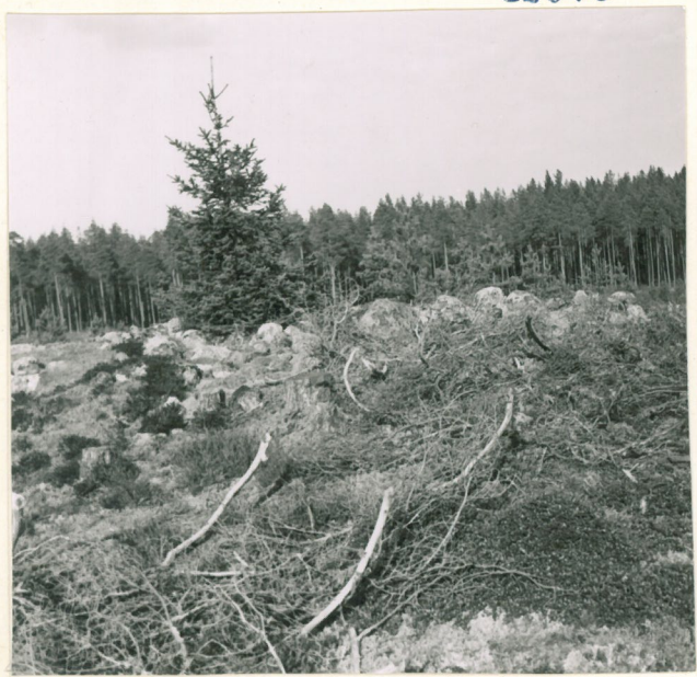
Intomaisita kivistä ladottu matala saunio.