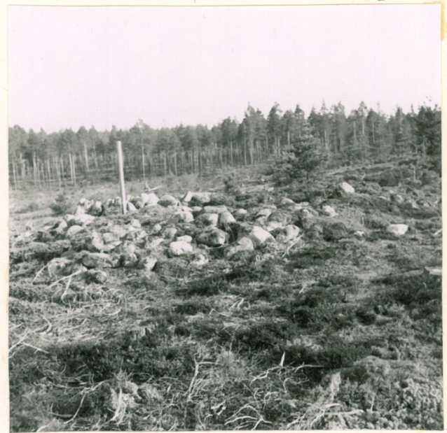
Hautasaunio, johon on kiinnitetty rauhortustaulu.