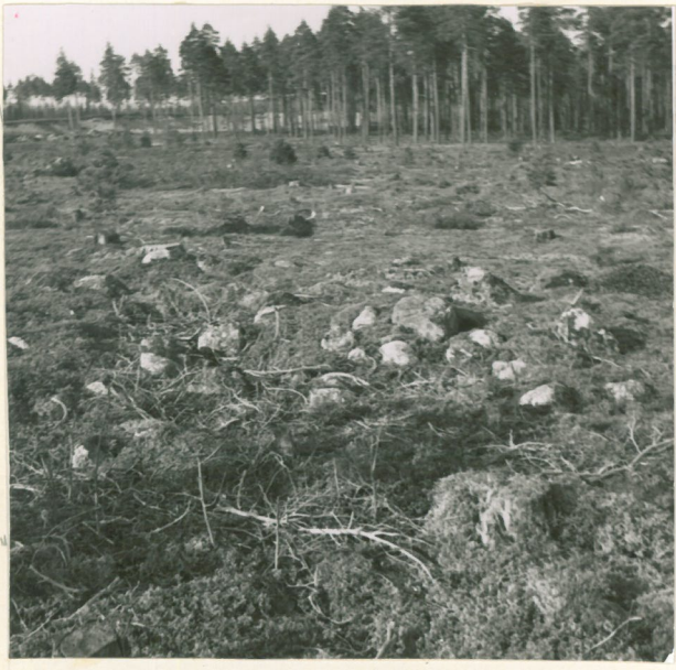
Matala hautasaunio (n:o 10).