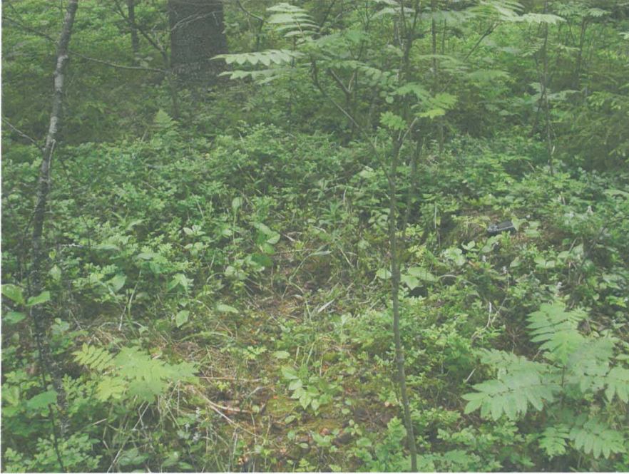
Kuva 3: Kehä, gps-laite pohjoislaidalla

Rakenne 2:em. kuoppaparista noin 40 metriä pohjoiseen sijaitsee halkaisijaltaan noin 2 m. oleva pyöreä kehä, jonka kehän paksuus on noin 30-40 cm, sisäkuopan halkaisija 1 m ja syvyys 40 cm. Rakennetta peittää paksu sammale, jonka alla maa on tummaa ja nokipitoista.