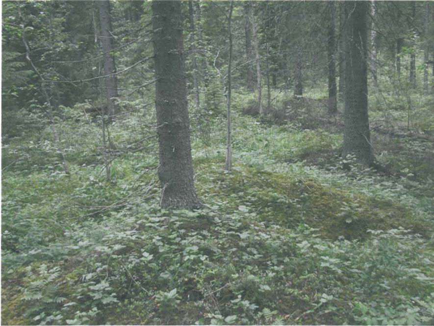
Kuva 1 : Kuoppapari

reilut 60 vuotta. (kuvat 1-2) . Rakennetta peittää paksu sammale, jonka alla maa on tummanruskeaa ja nokipitoista.