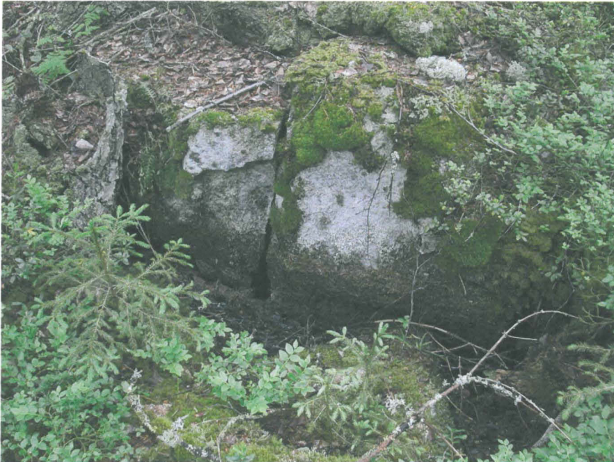
Kuva 5: halkaistu kivi