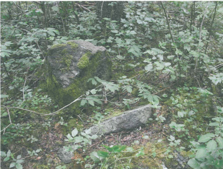
Kuva 4 : halkaistu kivi

Kahden rakenteen lisäksi lähimaastossa näkyi useita halkaistuja kiviä.