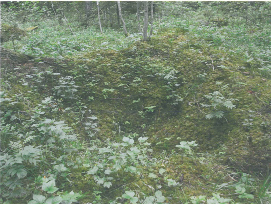
Kuva 2: pyöreä kuoppa