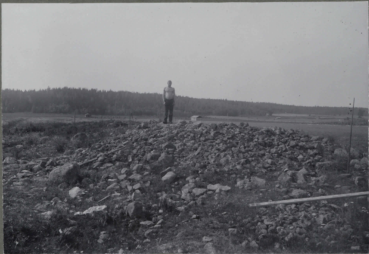
Kiukkainen, Uolinmäki Juholan pelto: poltettuja luuta sisältäviä tutkinut Fertilio kes. 1910.