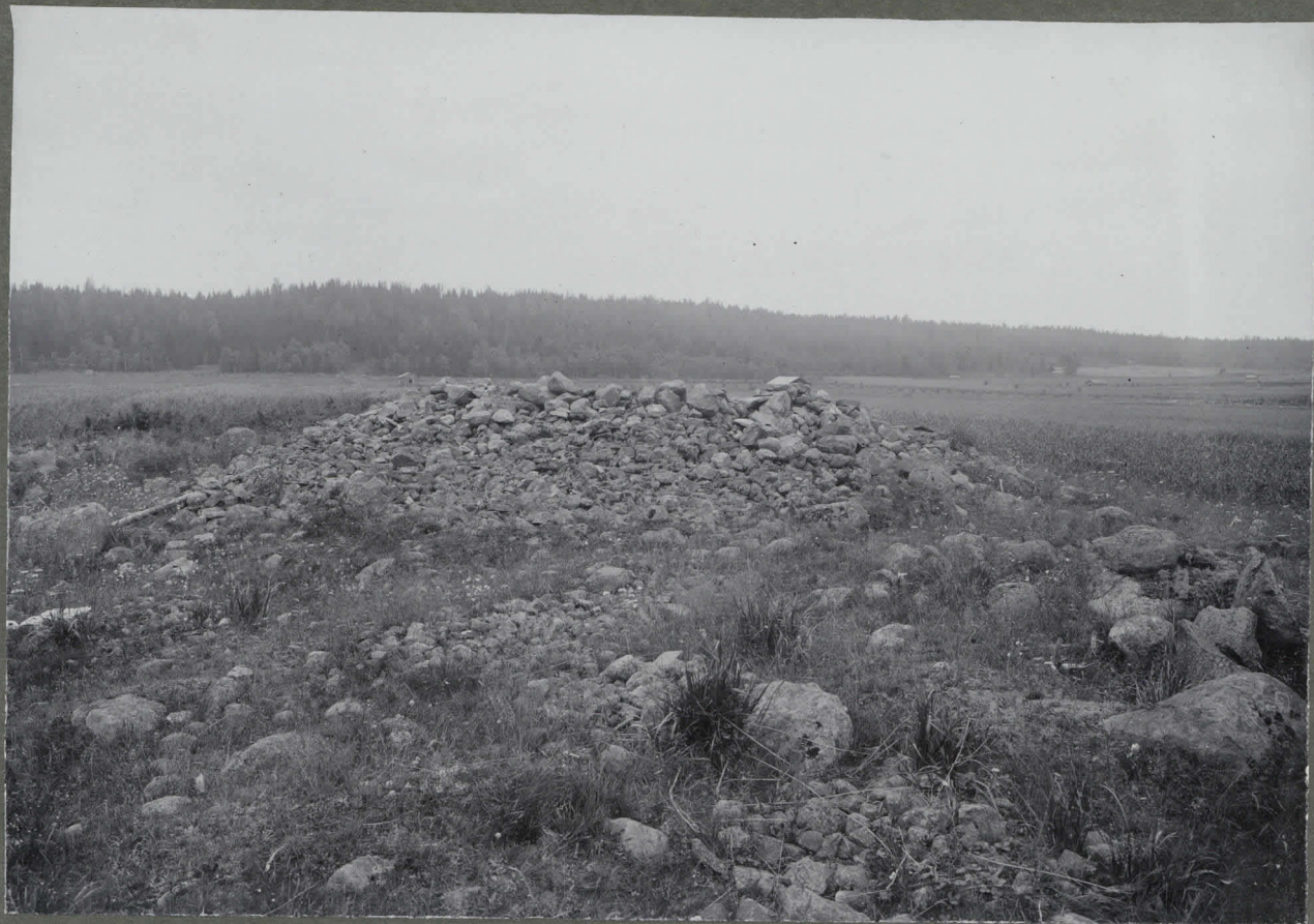
Kiukainen, Oloinmäki Juhola. poltettuja luuta sisältäviä nautta- raunio ennea avaamisista Tut kinut J. Ailio Kes. 1910.