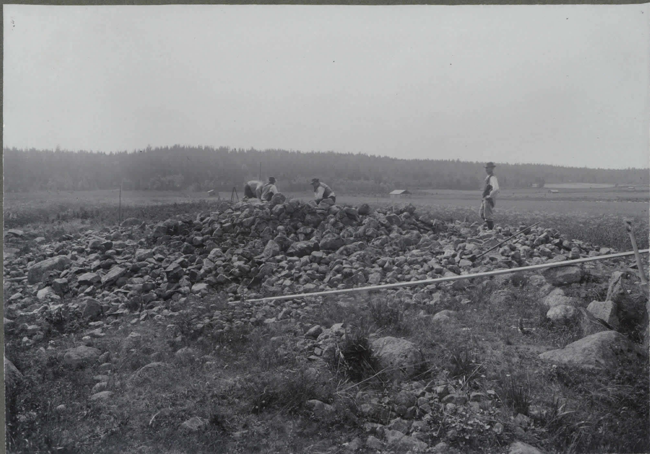
Kiukkainen, Nojimmäki, Juhola; jotettuja laita sisältäviä hauta- raunio, osaksi purettuna tutkinut Fabilio Kes. 1910.