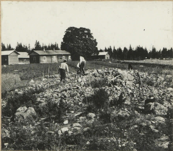
Kiukainen, Uotinmäki, Juholan torppa. J. Ailio 1910.