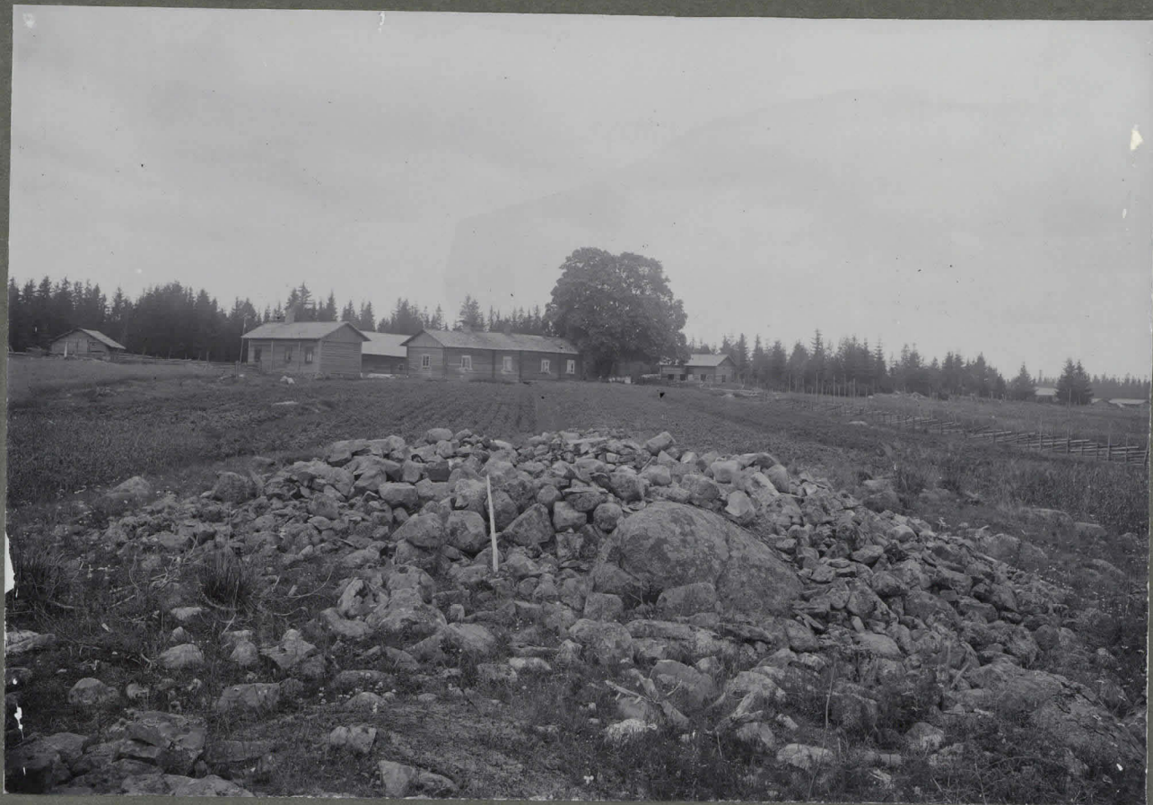
Kuukrinon, Uotimäki, Juhola (taus- talla oleva torppa): pöytästä luuta sisältävä hautausmaahan ouna avaamista Jekition johdolla Kes. 1910.