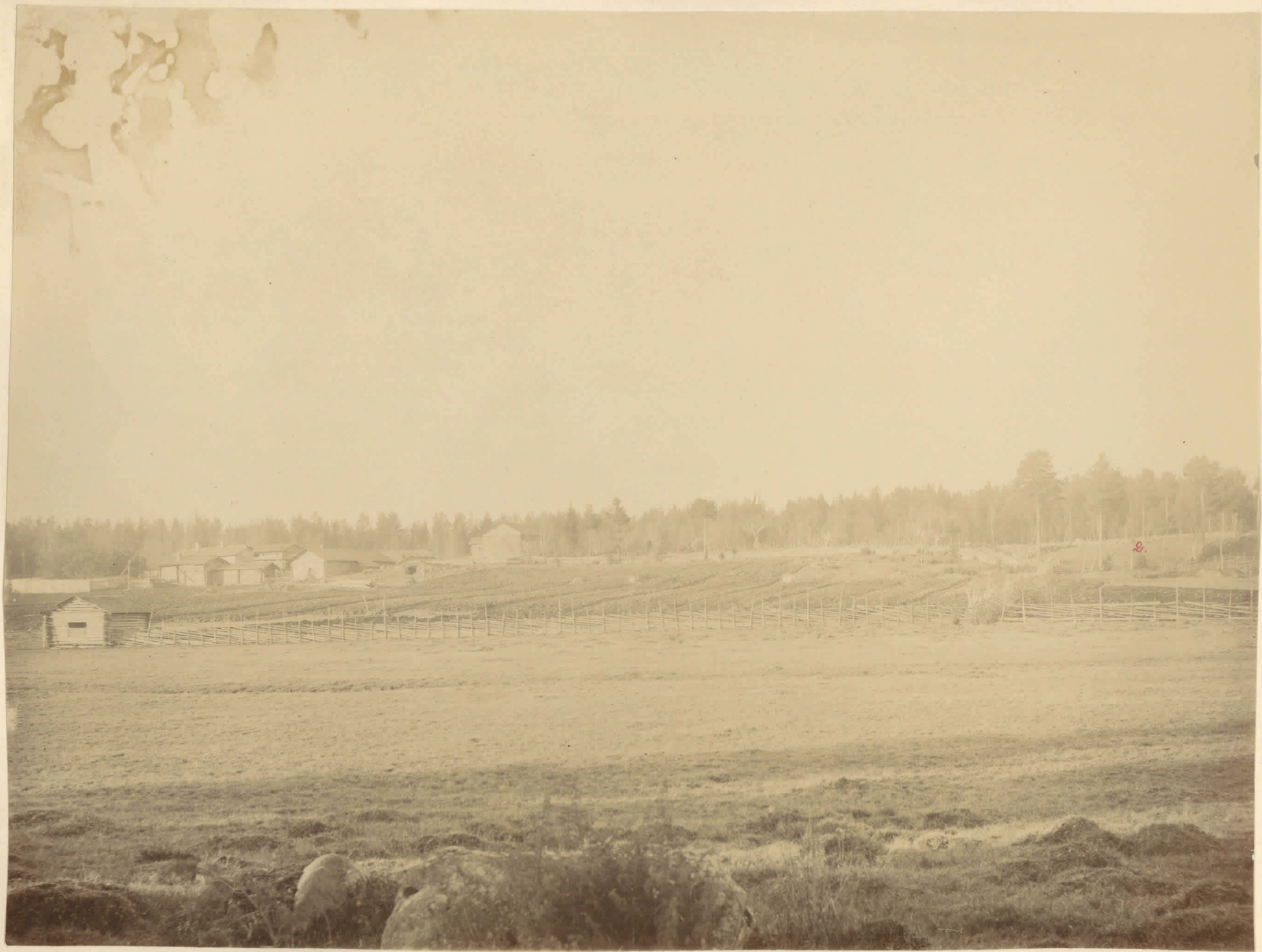
Utsikt från foten af Uotimmäki-bäret öfver den nedan som denna belägna dalgången och den motsatta sluttningen, platsen för fynden från stenåldern. 2. Tvänne slösläder från sten- åldern. Se H. J. Heikens berättelse 26 1897 t. S. 28.