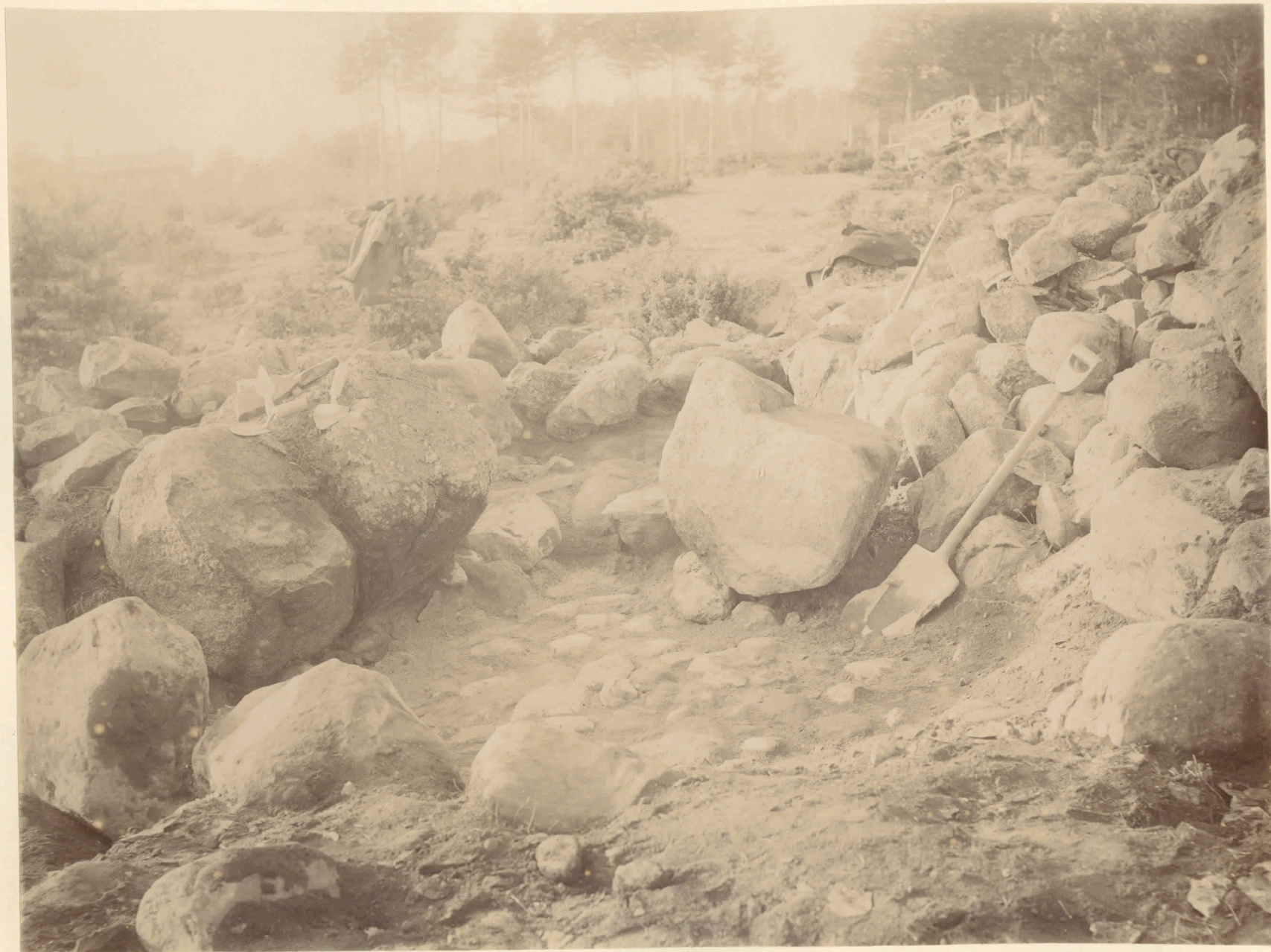
Gröföset från stenåldern i "Uotinmäen Kuluakunta". Melllersta området. Se H. J. Heikets berättelse 26 XI 1897 tidn. s. 54.