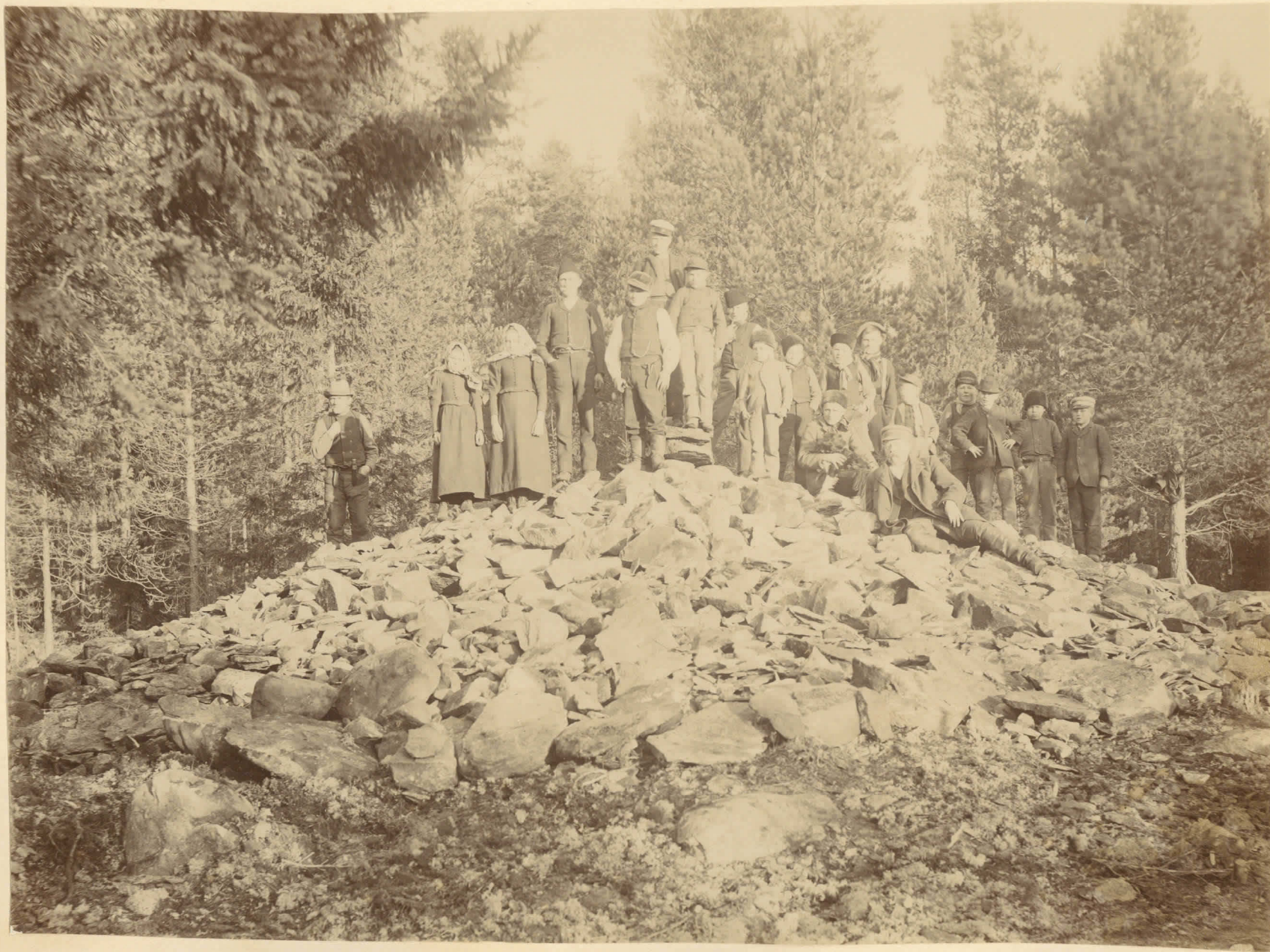
Gräfsse från bronsåldern å Kaunismäki. Riset återställt efter undersökningen. Se H. J. Heikes berättelse 26/11 1897 till A. K.