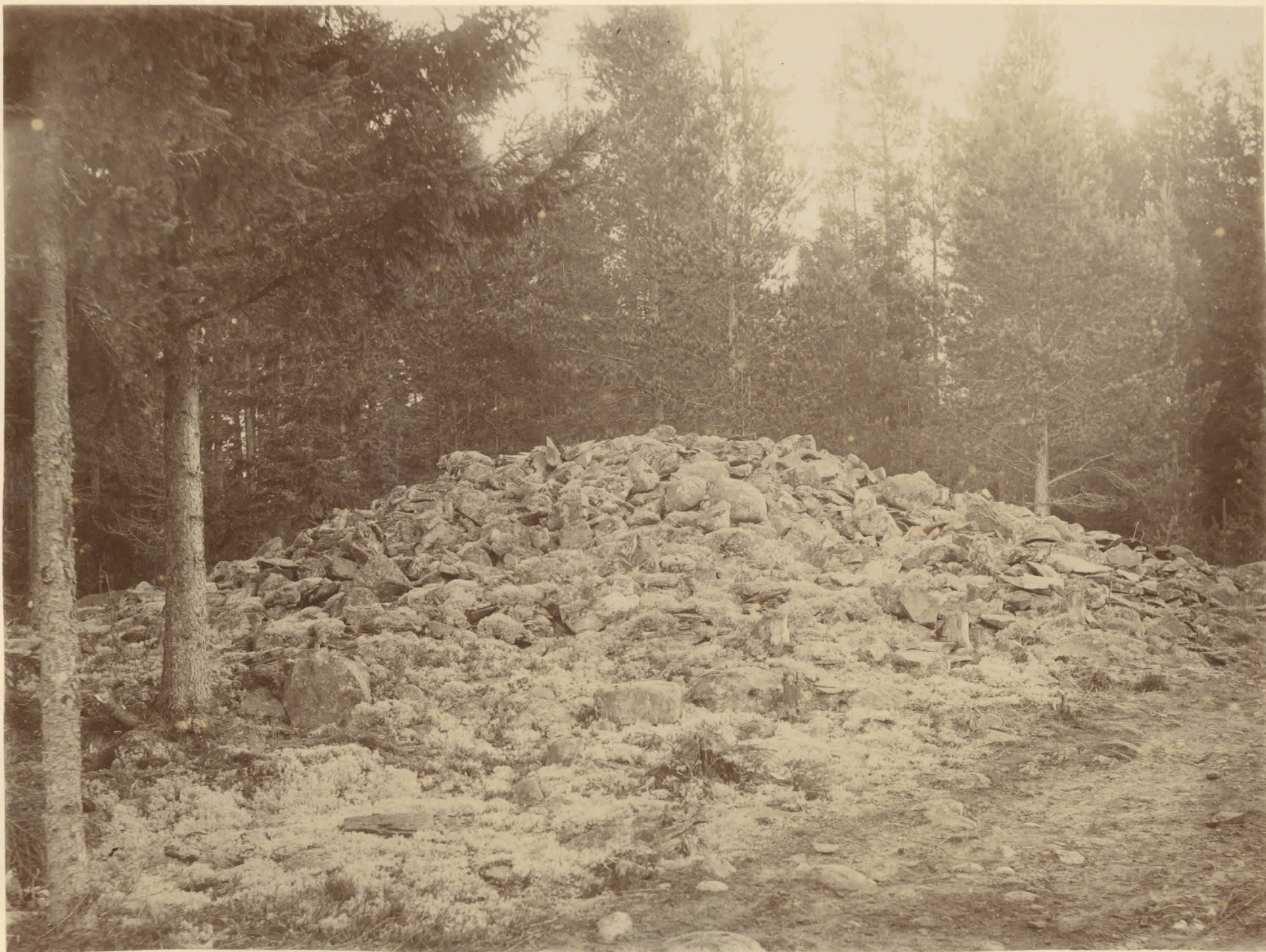
Gräfsö från bronsåldern å Kaunismäki. Riset före undersökningen. Se H. J. Helsingfors berätt. 1897 s. 26.