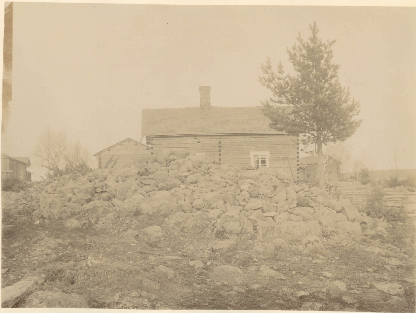
Gräfsöset från stenåldern å „Uotinmäen Kulmakunta, Rösen återställt efter undersökning. Se H. J. Heikels berättelse 26/XI 1897 till S. 38.