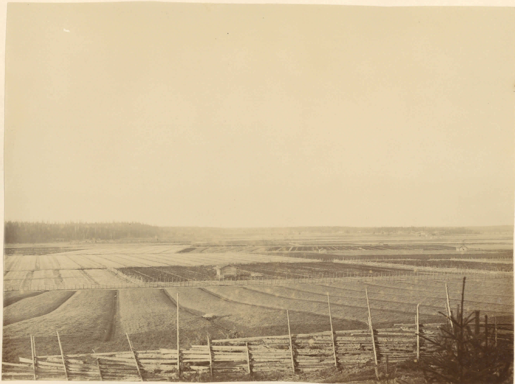
Utsikt från Kaunismäki öfver „Uotinmäen Kulmakunta“ (Till vänster Uotinmäki- bärgen, till höger platsen för fynden från stenåldern. Se H. J. Heikelo berättelse 26/11/1897 sid. 8.