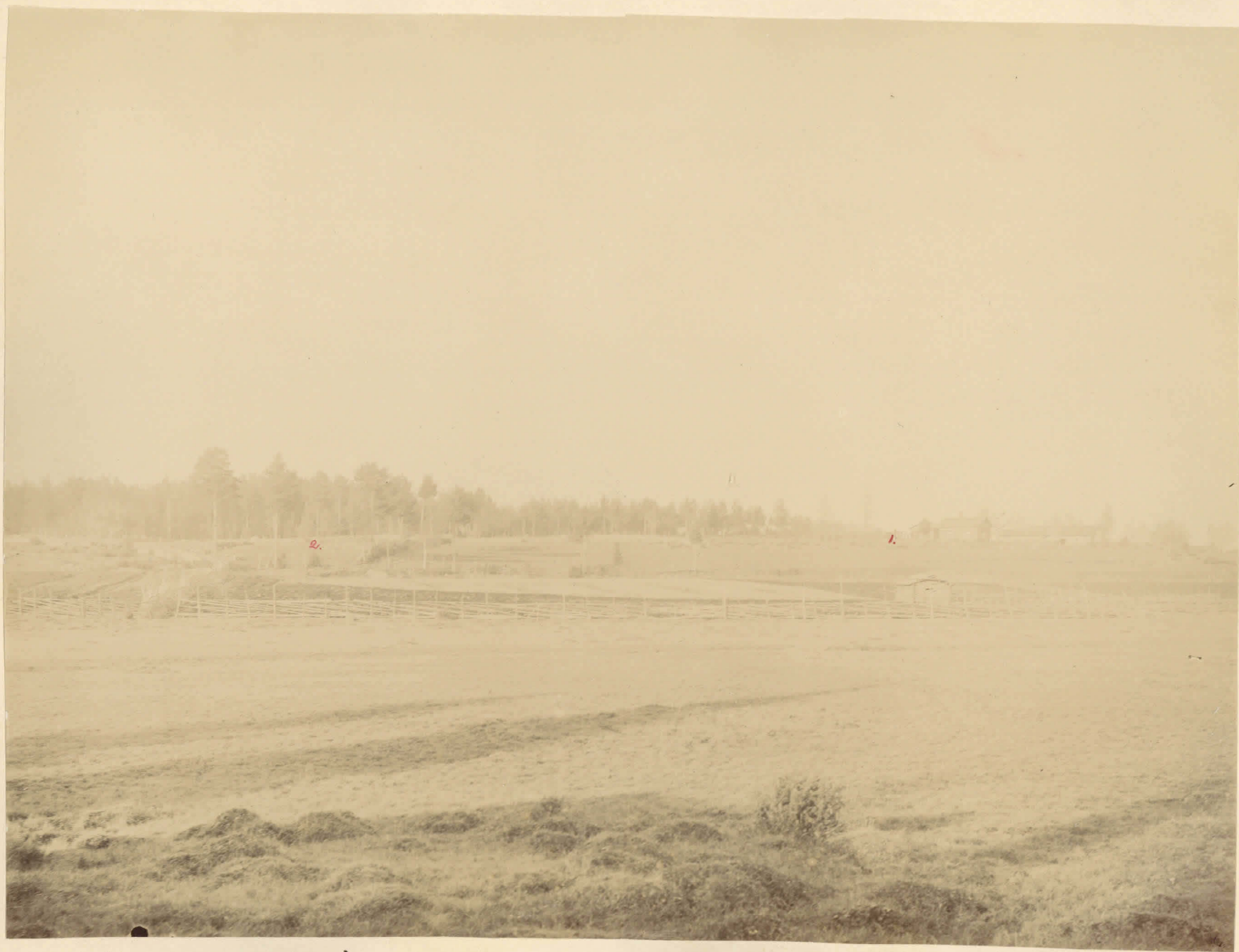
Utsikt från foten af Uotimmäkitärgen öfver den nedanom denna belägna dalgången och den motsatta sluttningen, platsen för fynden från stenåldern. 1. Gräspöse från stenåldern. 2. Tvänne eldstäder från stenåldern. Se H. J. Heikel's berättelse 26 1897 till S. H.