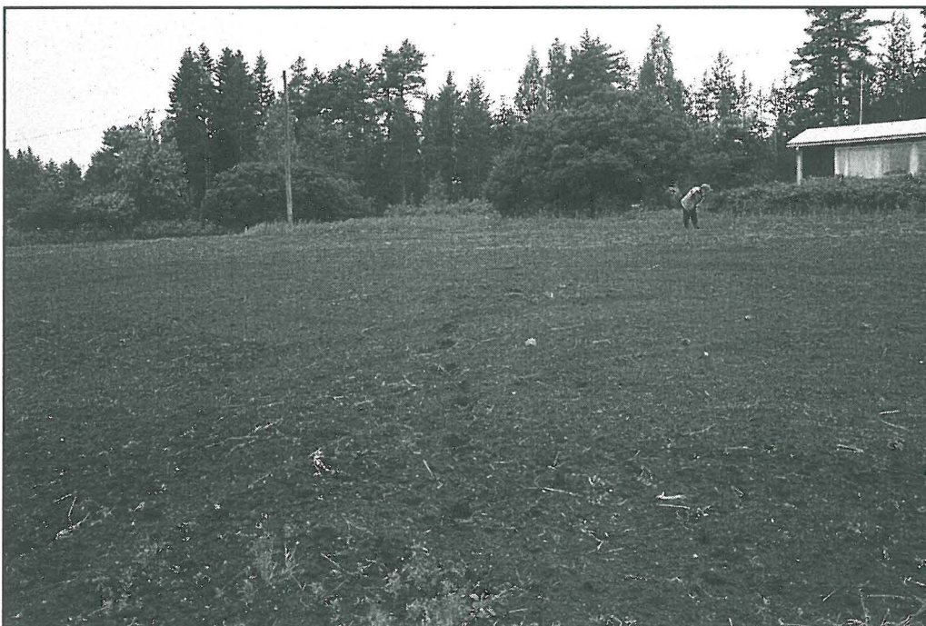
Kuva 2. Asuinpaikka-alue pääasiassa talon vasemmalla puolella olevien pensaiden takana. Oikealla Irma Hirvi.