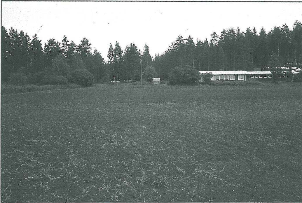
Kuva 1. Löydöt pääasiassa taustalla olevan kasvimaan ja viereisen peltosaran alueelta. Löytöjä harvakseltaan myös kuvanottoipaikkaan ja laajemminkin. Oikealla Nuottimäen talo. Kuvattu pohjoiseen.