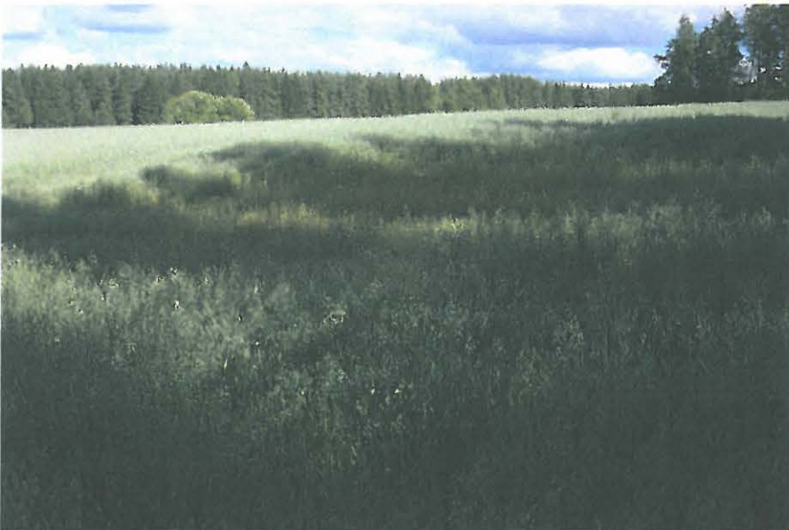
DG 852:2. Rautakuonan löytöpaikka kuvan etualalla, notkelmassa, lounaasta.