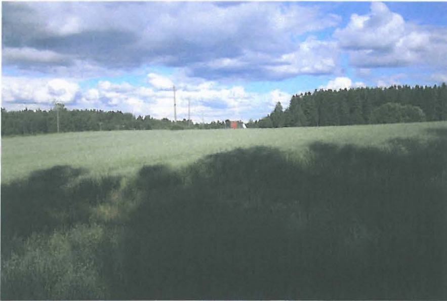
DG 852:1. Rautakuonan löytöpaikka kuvan etualalla, notkelmassa, lounaasta.

Lappeenranta Kujanpää, tarkastus 2009 Petro Pesonen