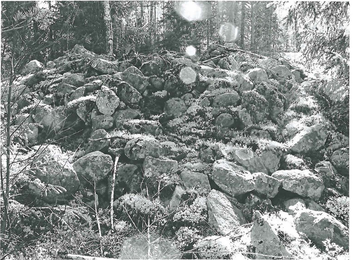
Röyhkiö kuvattuna polygoisesta.