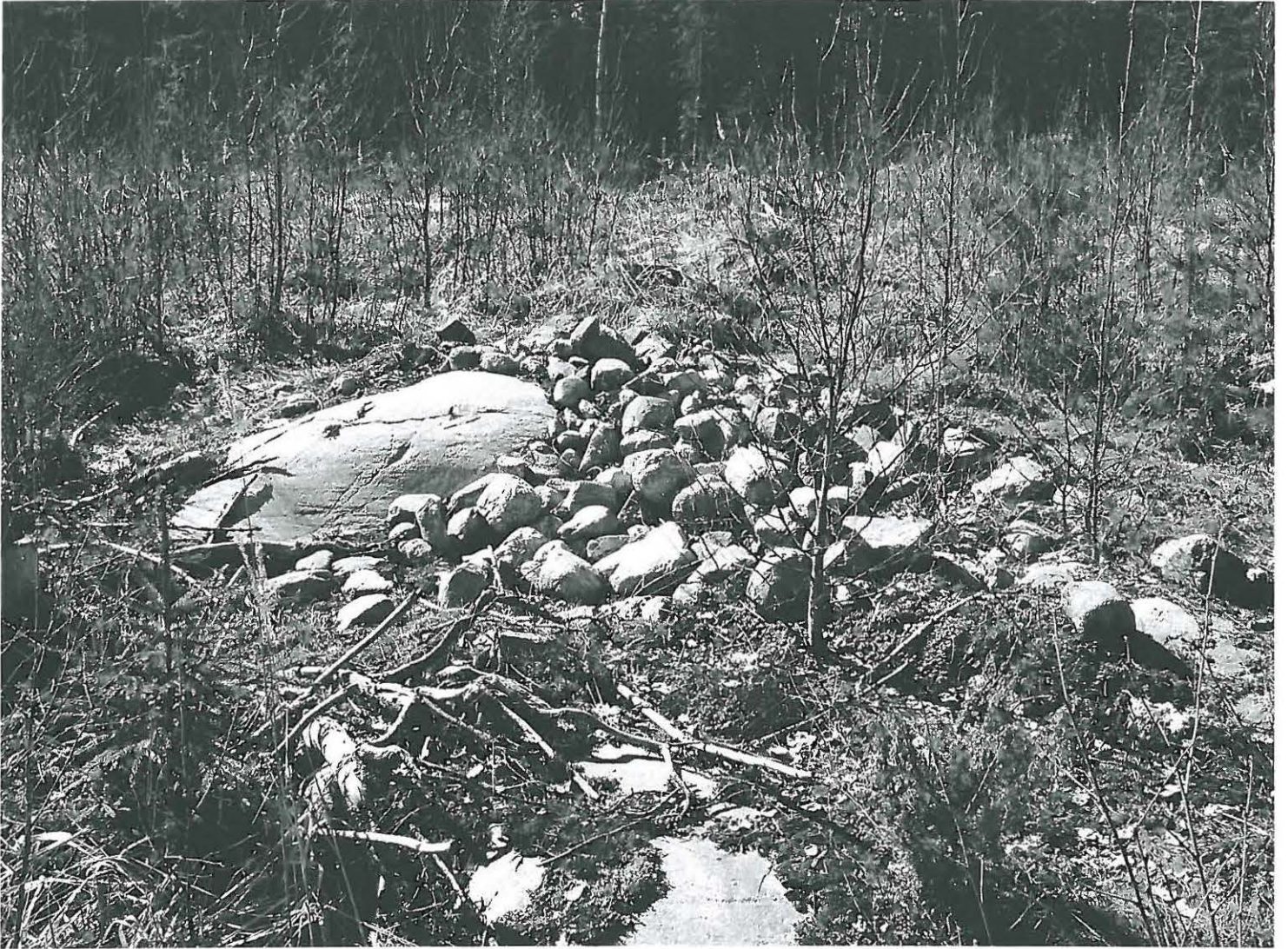
Osin tuloukunanut röyheliö 1 kuvattuna luoteesta.