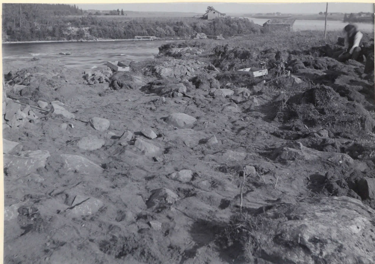
2. Brandgraffältet på Myllymäki under pågående undersökning: stenplanen efter torfvens aflägsnande.