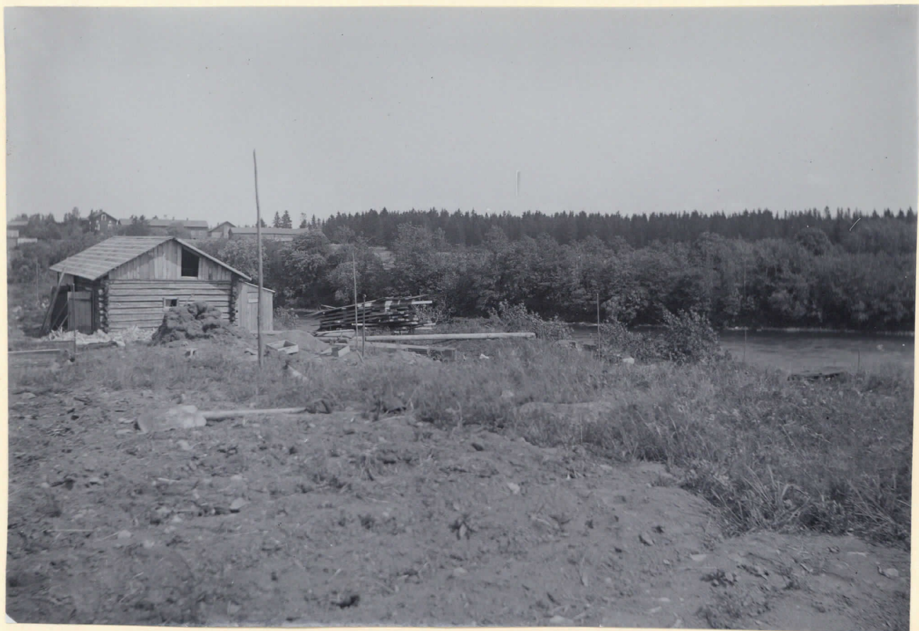
3. Myllymäkis östra kant. I mitten Pahdinginkoski, i bakgrunden till vänster på Kumoelfs vänstra strand Hassala hemman. Bilden är tagen från SW mot NO.