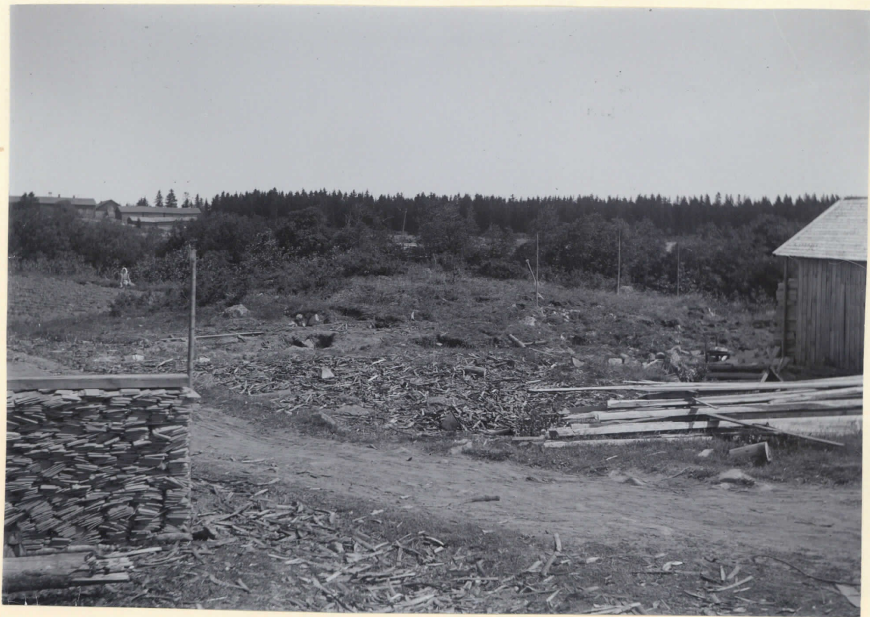
4. Myllymäkis nordöstra ända, sedd från mjölnarens bodingshus mot NO. I bakgrunden till vänster Hassala hemman.