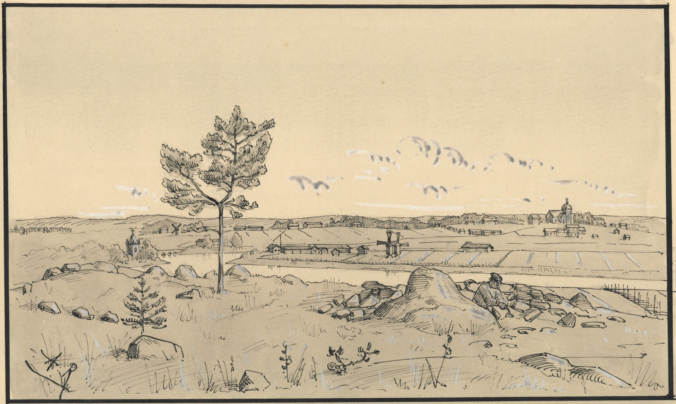
Kokemäki. Näköala varhemman rautakauden kalmistolta Koonikänmäellä. Hautausainio tutkittu 1885.