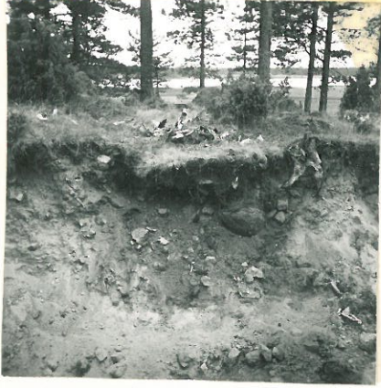
Nokinen kiveys hiekka- kuopan seinämässä. Taustalla Saarnijärvi. (Pienempi nokikuoppa).