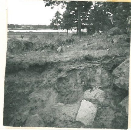
Suurempi nokikuoppa ja isoja kivilatomusta.