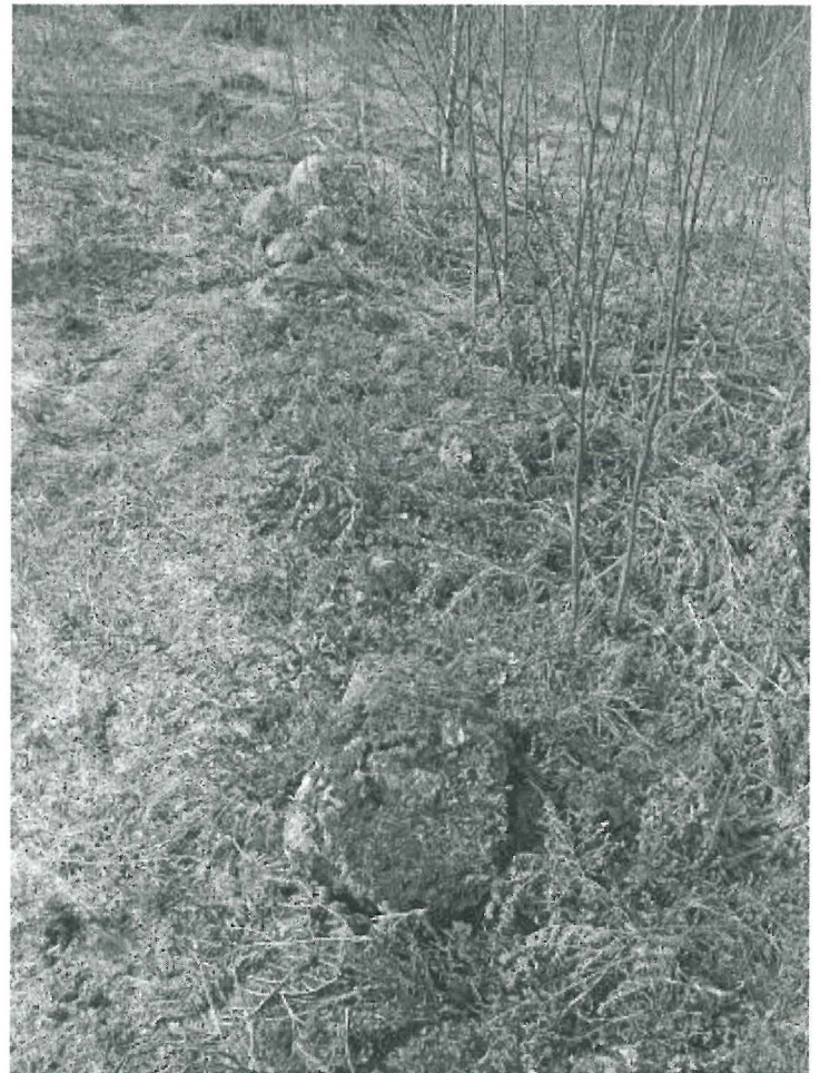
Kuva 3. Linnavuoren valla (tummempi, sammaleinen alue kuvan keskellä).