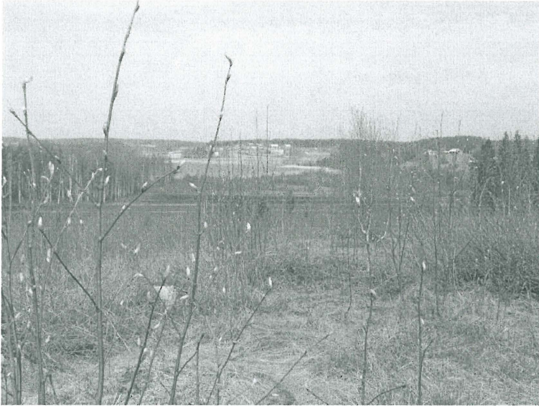
Kuva 1. Näkymä Linnavuoren laelta kohti Hannanlahden pohjukkaa, jossa Keskitalon kuppikivi sijaitsee.