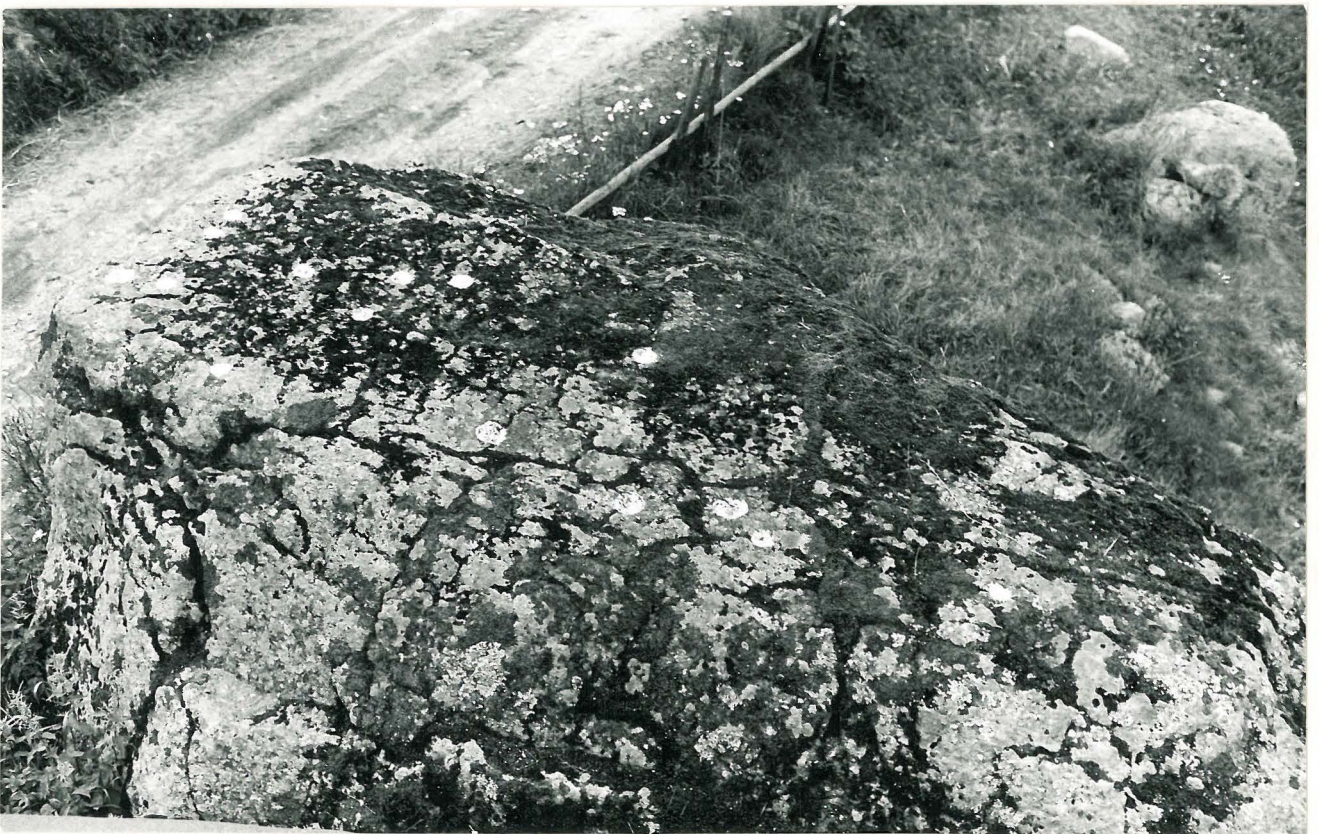
KUVA 2. UHRIKUOPAT LIIPUTTUNA