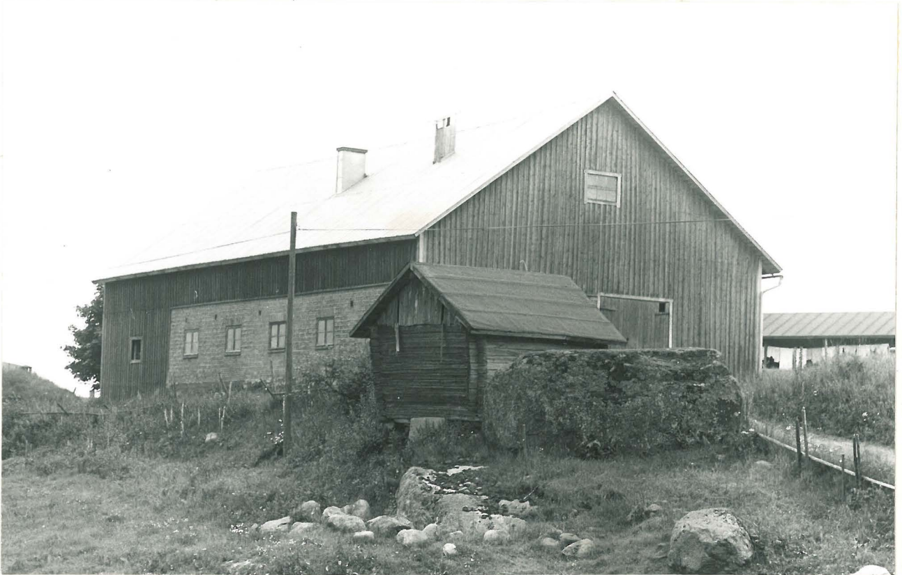
KUVA 1. UHRIKIVI PIENEMMÄN UKKORAKENNUK- SEN ETUPUOLELLA