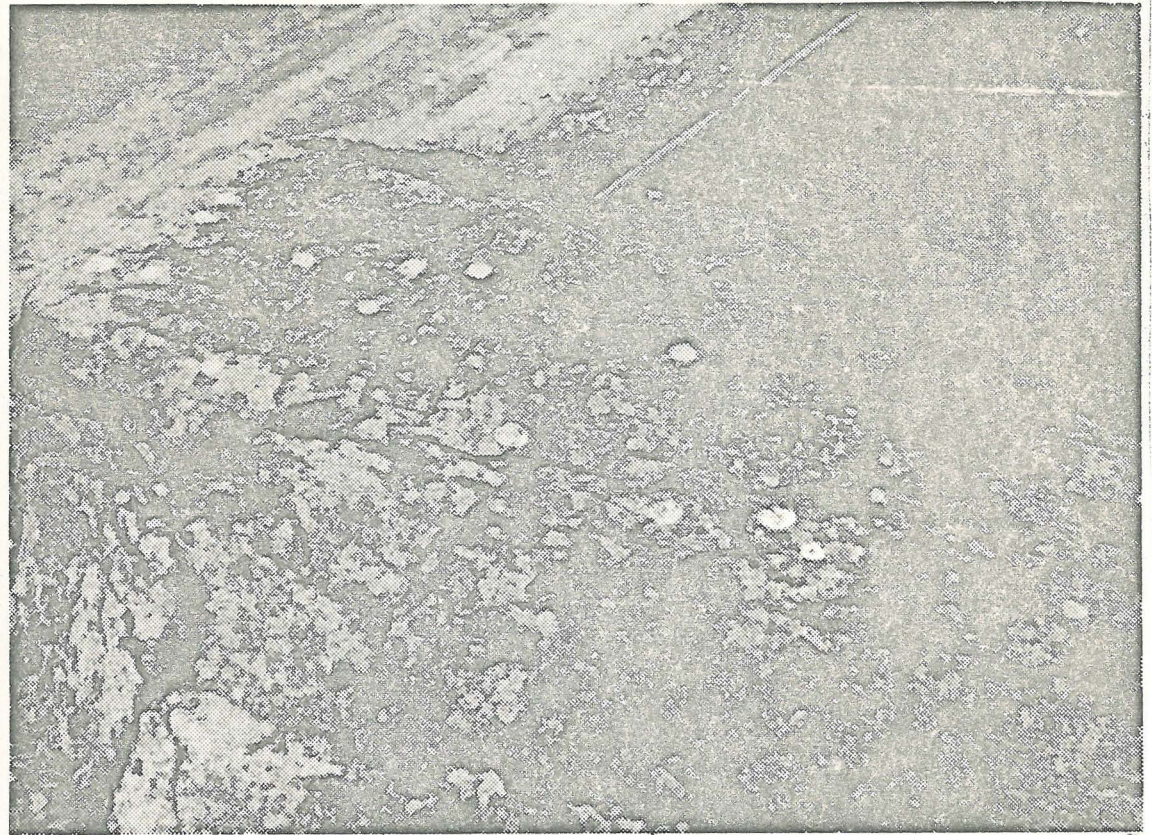
Urolan uhrikiven kupit on merkitty kuvassa valkoisella liidulla.

selkeänä muistona vuosisatain takaisista tavoista. Muinaismuistolaisten nojalla se on rauhoitettu säilytettäväksi jälkipolville muistona noista taikauskaisista ajoista.