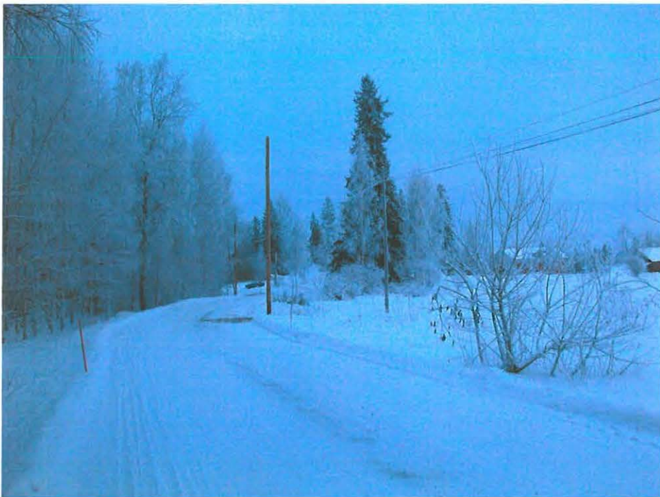
Hauralantie etelästä, tien varressa uusittavat pylvää.