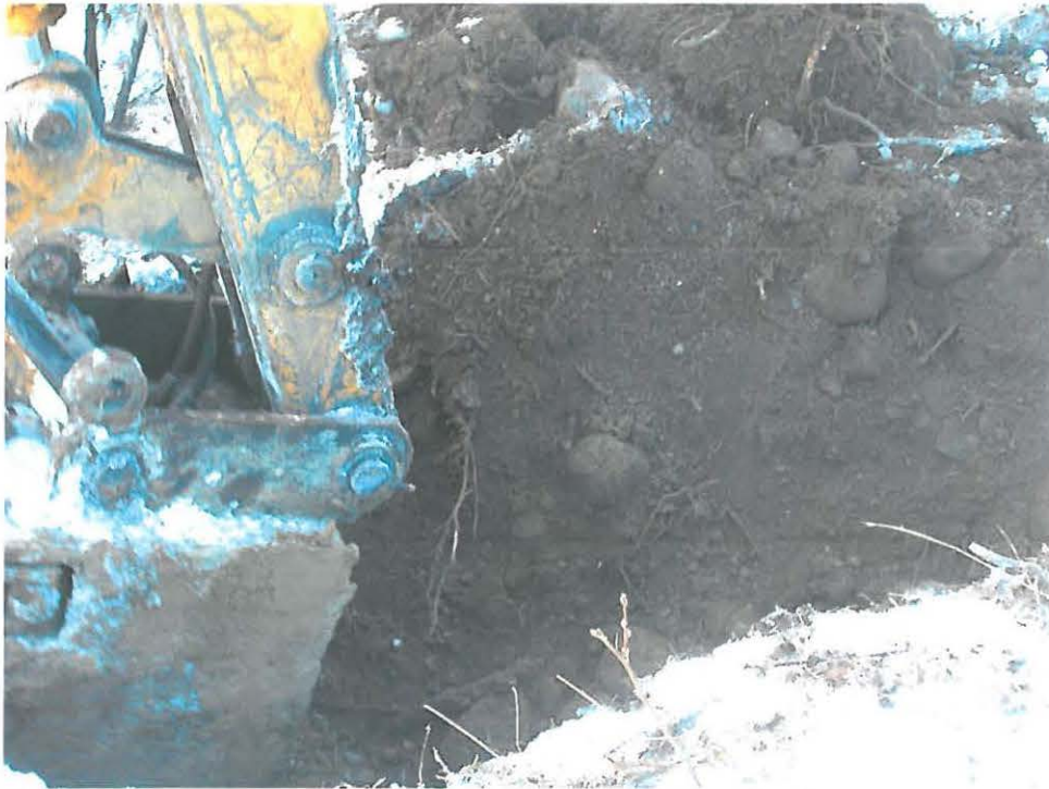
Pylvään 2 uutta kuoppaa kaivetaan, kuvattu kaakosta.