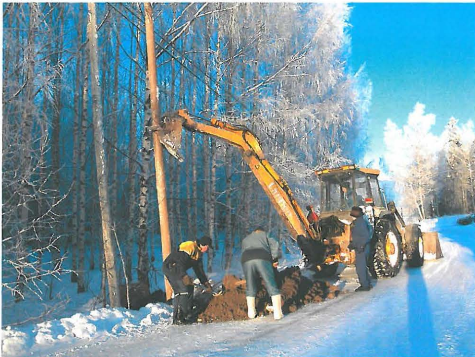
Uuden pylvään 2 kuoppaa kaivetaan, kuvattu eteläkaakosta.