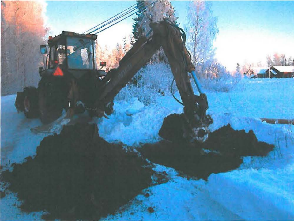
Pylväspaikka 1, kuvattu etelästä.