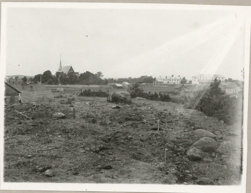
Laitila, Kansakoulumäki, Kaivausalue 1933. Oikeassa kulmassa olevat kivet ruu- dissa c 2-c4 kartalla. Kuva otettu S:stä päin.