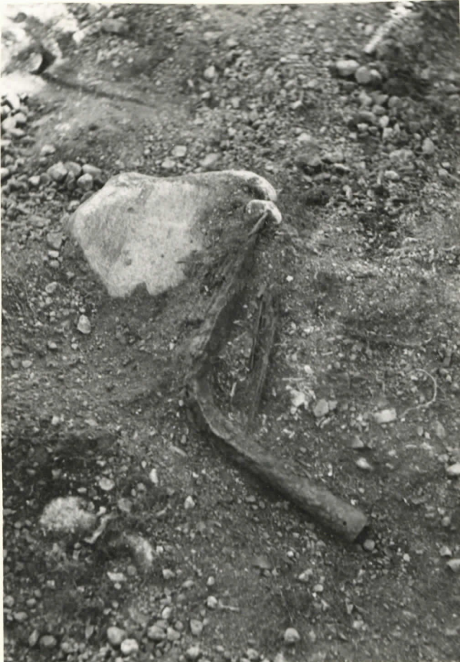
2. Hautasta löydetty kiihäänkänki sekä osa veistä näkyvissä. Kuva on otettu lähes suoraan ylhäältä päin.