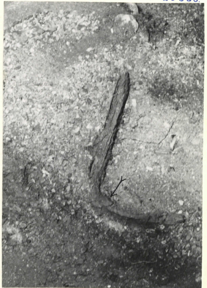
3. Veitri paikallaan maassa. Terän kummallakin puolella erottuvat saattalevyt lienevät juuren heloja. Nuolen osoittamassa kohdassa kahvan rengas.