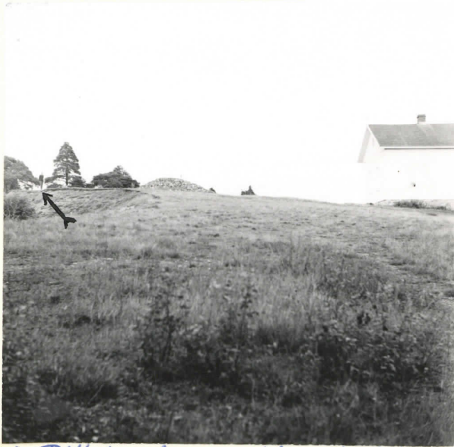
1. Polttohaudan paikka Laitilan rukoushuoneenmäellä omoleu osoittamassa kohdassa. Oikealla rukoushuone, keskellä suuri kivikasa. Kuva on otettu eteläkuntaasta.