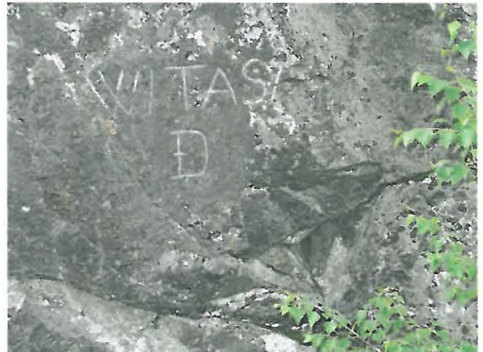
Kuva 10. Teksti: Witasy (?), D