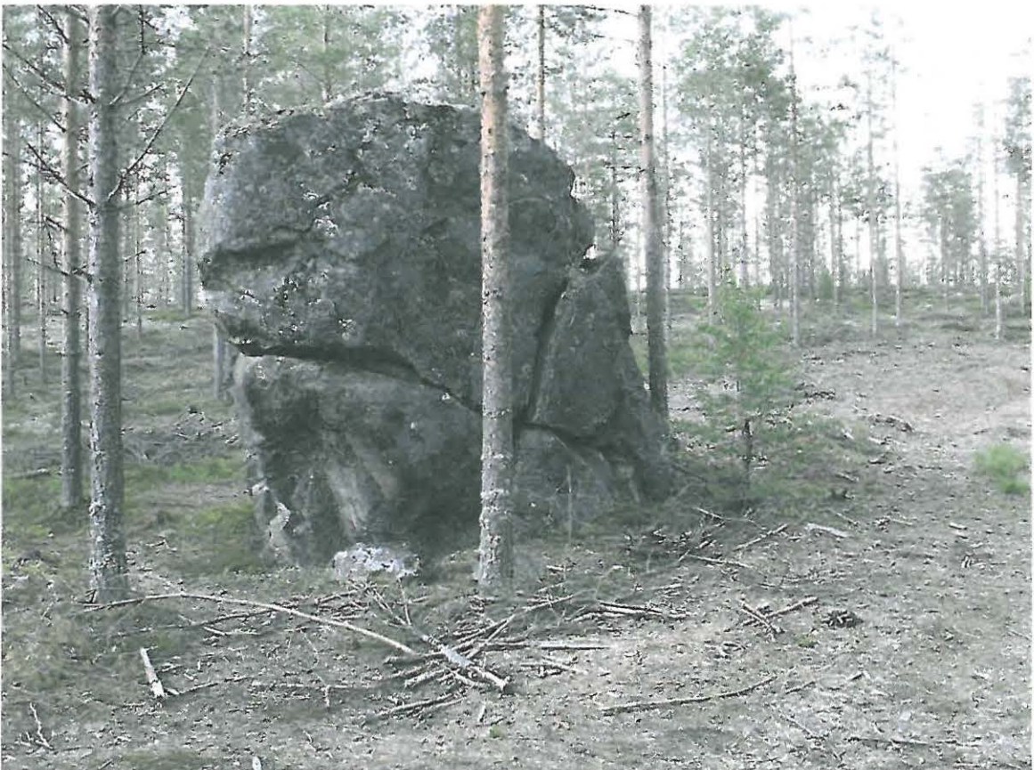
Kuva 6. Savon ja Pohjanmaan välinen rajakivi.