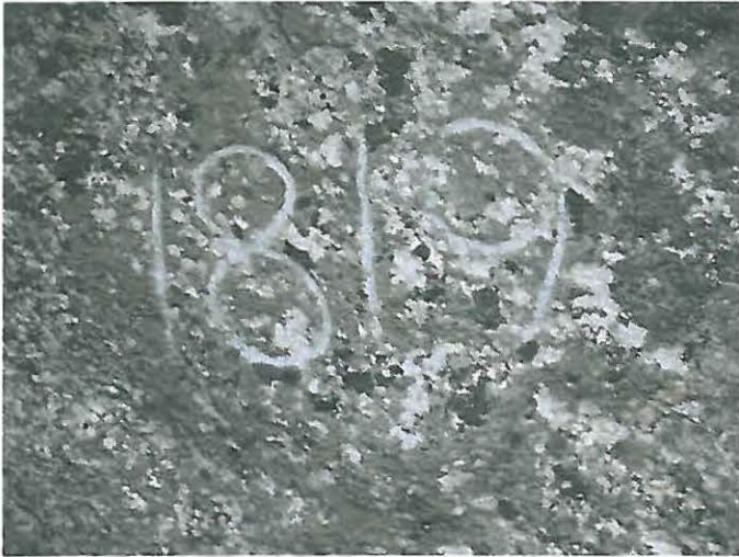
Kuva 7. Vuosiluku: 1819.