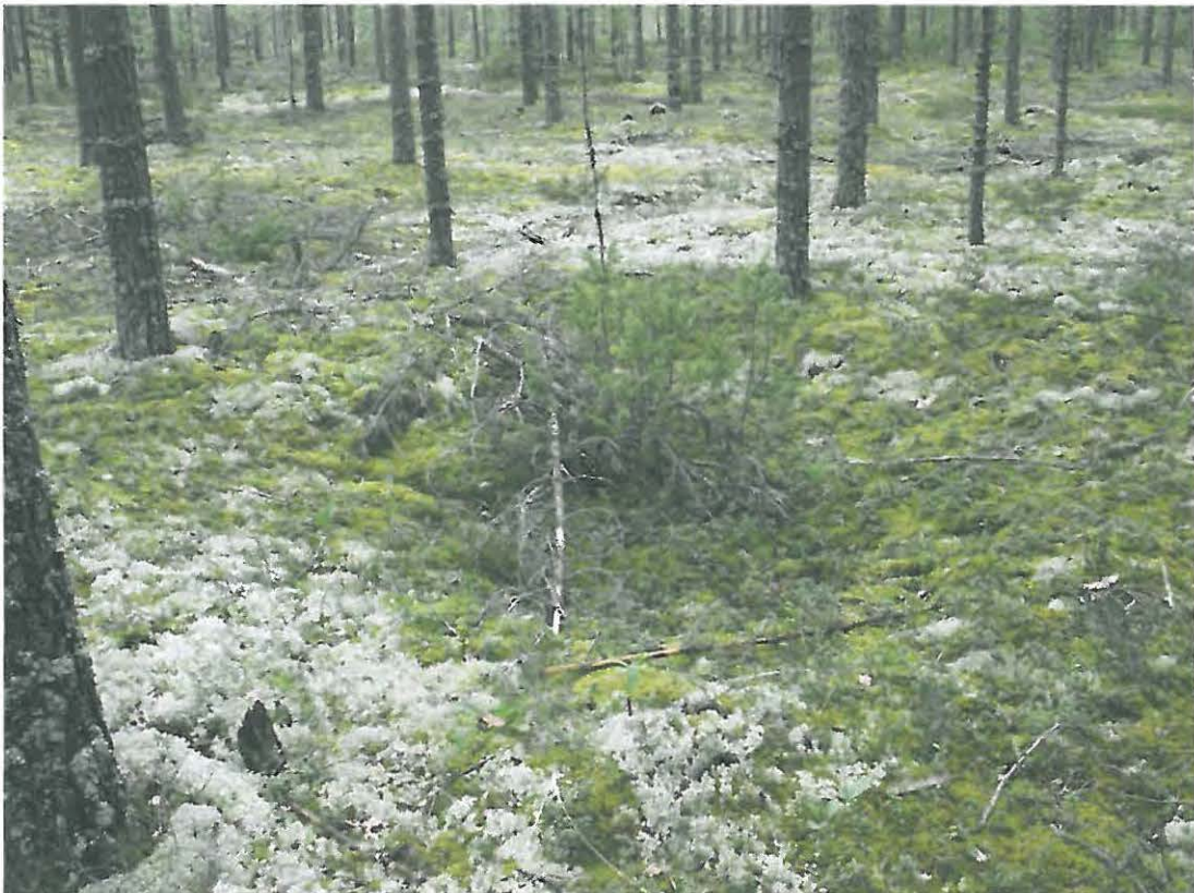
Kuva 2. Painanne kuvan keskellä. Kuopat sijaitsevat selvissä jonoissa.