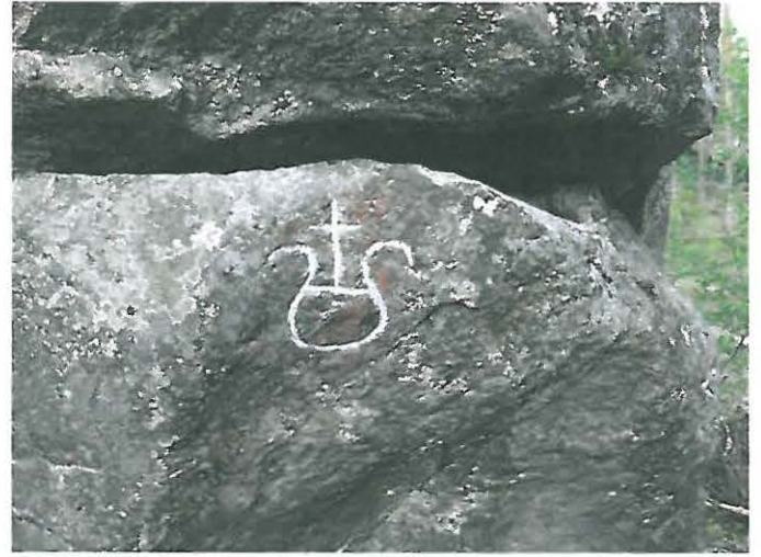
Kuva 8. Piirros: Kruunu.