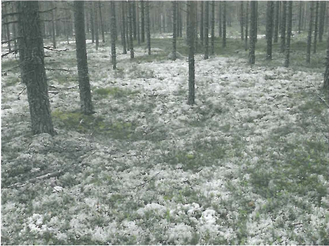
Kuva 1. Alue on jäkälää kasvavaa mäntykangasta. Kuopanne kuvan keskellä.