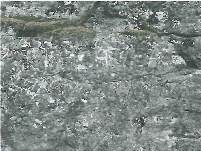
Kuva 9. Teksti: Lochtaeå, AO