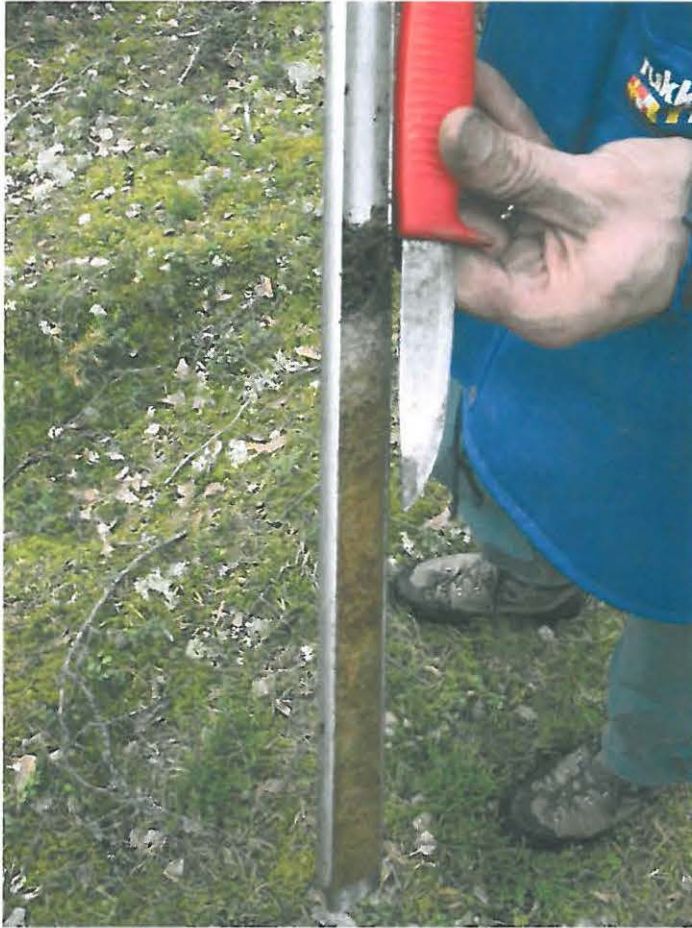
Kuva 5. Pintaturpeen alla oli muutaman cm:n paksuinen vaalea huuhtotumiskerros, jonka alla oli punertava rikastumiskerros ja normaali hiekkakerros.