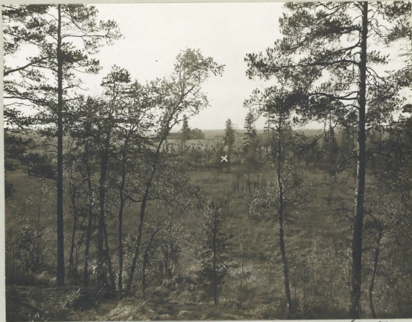
Kuva 1. Löytöpaikka etäämpää, jokseenkin idästä. Etualalla ruohot, taaksepänä onatala heijanne, jolla löytö- paikka on (x); sen takana Suljennon suo- viljelykseen. 24. IX. 1929. lev. 7319.