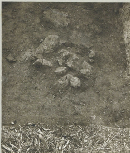
Kuva 5. Kiviliesti ruuduilla F-K: 11 ete- lästä päin. Saam- pona isompi "pank- kokivi" 24. IX. 1929.