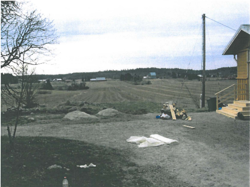
2. Lieto, Peltokallio. Peltokallion tilan pihapiiriä, jossa vasemman puoleisessa avokalliossa on ainakin 5 uhrikuppia. Kuvattu pohjoisesta kohti Savijoen laaksoa. DT2009:32:16:025