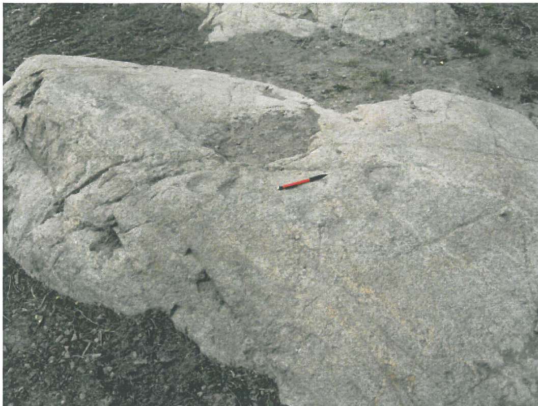
3. Lieto, Peltokallio. Peltokallion tilan pihalla oleva avokallio, jossa on ainakin 5 uhrikuppia. Kuvattu koillisesta. Kuva: H. Brusila. DT2009:32:16:023