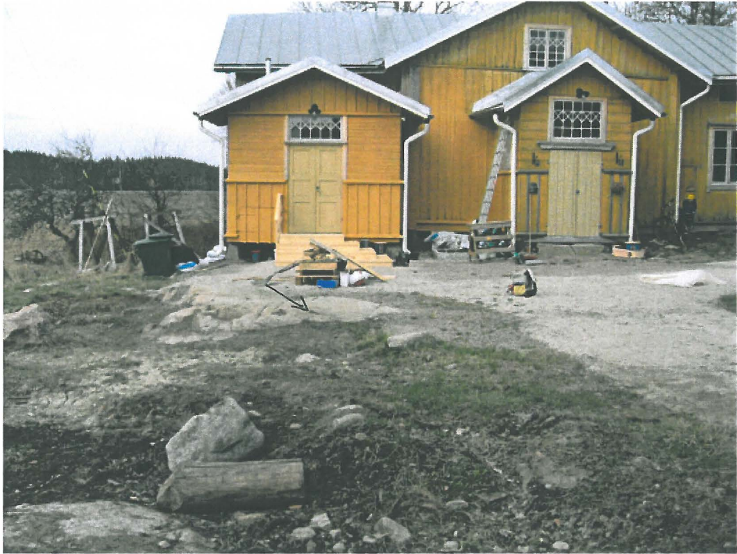
1. Lieto, Peltokallio. Peltokallion tilan pihapiiriä, jossa keskellä olevassa avokalliossa on uhrikuppeja n. 5 kpl. Kuvattu idästä. DT2009:32:16:021