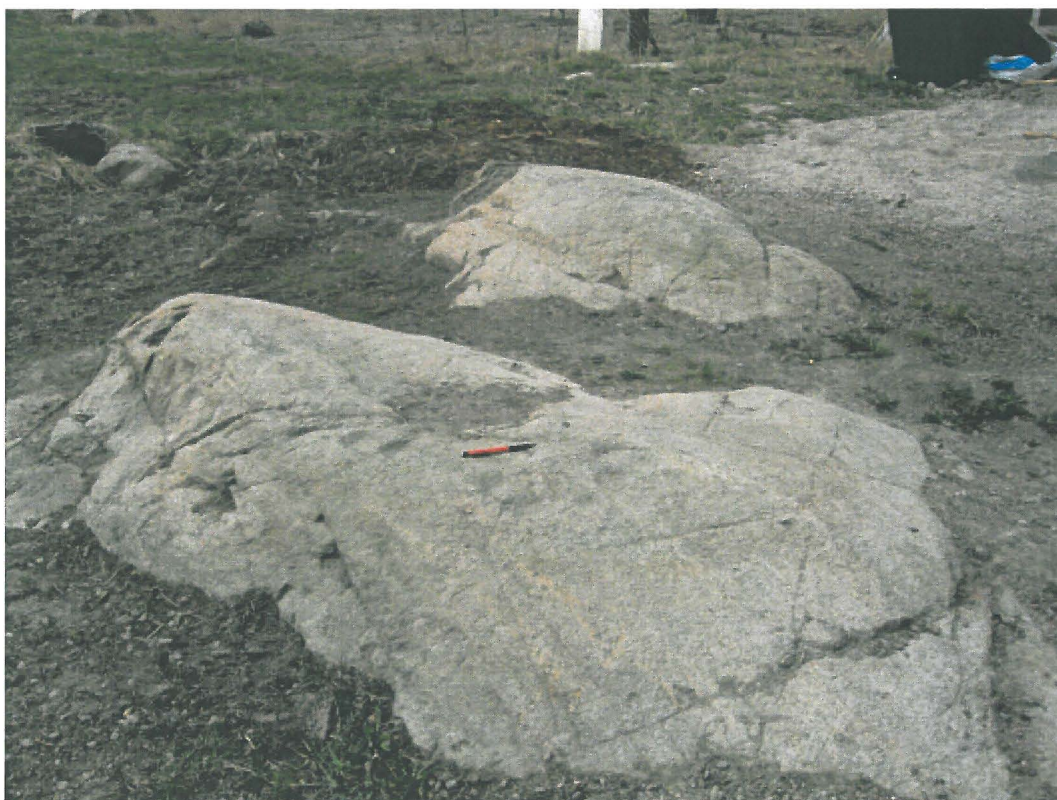
Lieto, Peltokallio. Peltokallion tilan pihalla oleva avokallio, jossa on n. 5 uhrikuppia. Kuvattu koillisesta. DT2009:32:16:020