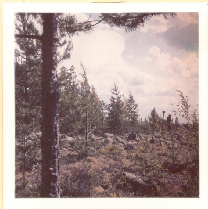
Liminkamaan linnan vallia. Läntinen pitkäseinä luoteesta kuvattuna. Rauhoitustaulun luona Kotirannan isäntä.