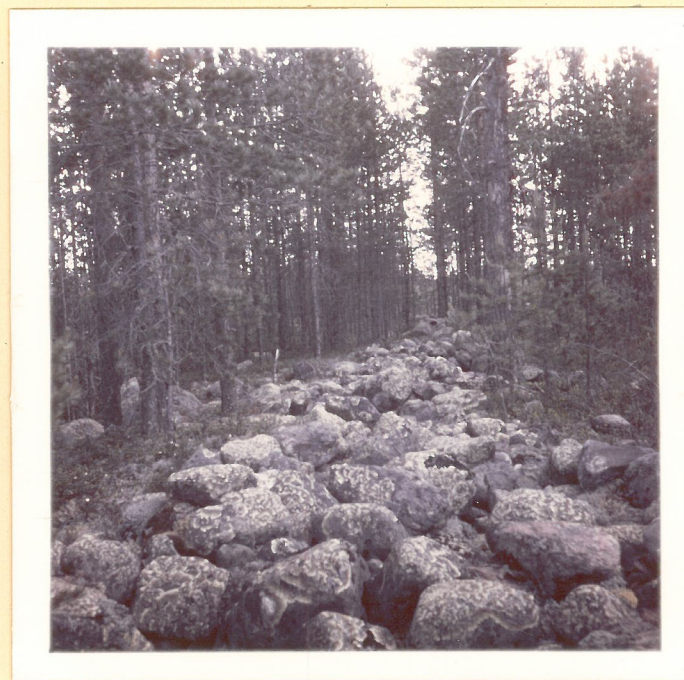
Liminkamaan linnan vallia. Itäinen pitkäseinä poh- joisluoteesta kuvattuna.