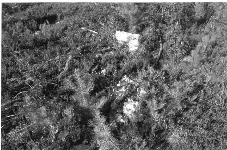
Kuva 2. Kvartsilouhos. S-N. 26.7 (f. 118764).