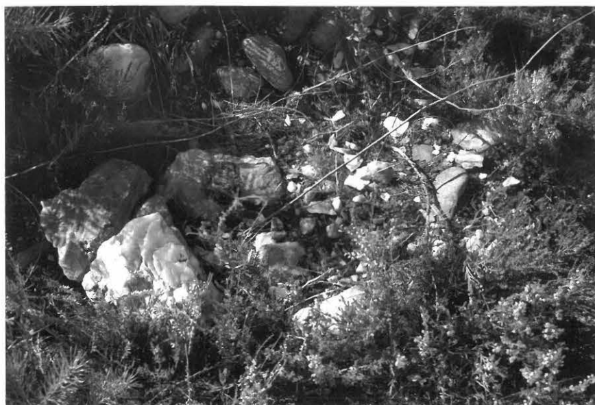
Kuva 3. Kvartsikappaleita ja -iskoksia louhoksella. 26.7 (f. 118765).