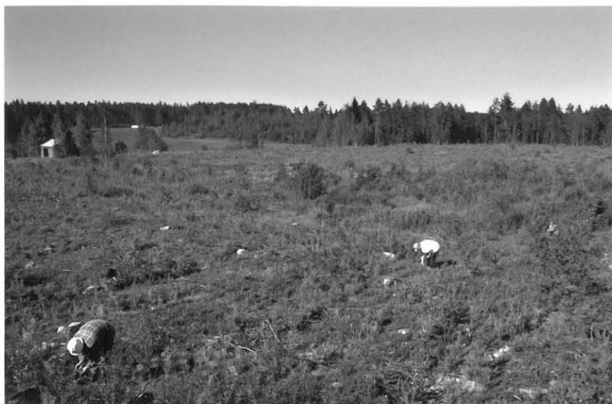
Kuva 1. Kvartsilouhos, Mirja Hyttinen (valkeassa paidassa) louhoksen luona. S-N. 26.7 (f. 118766).