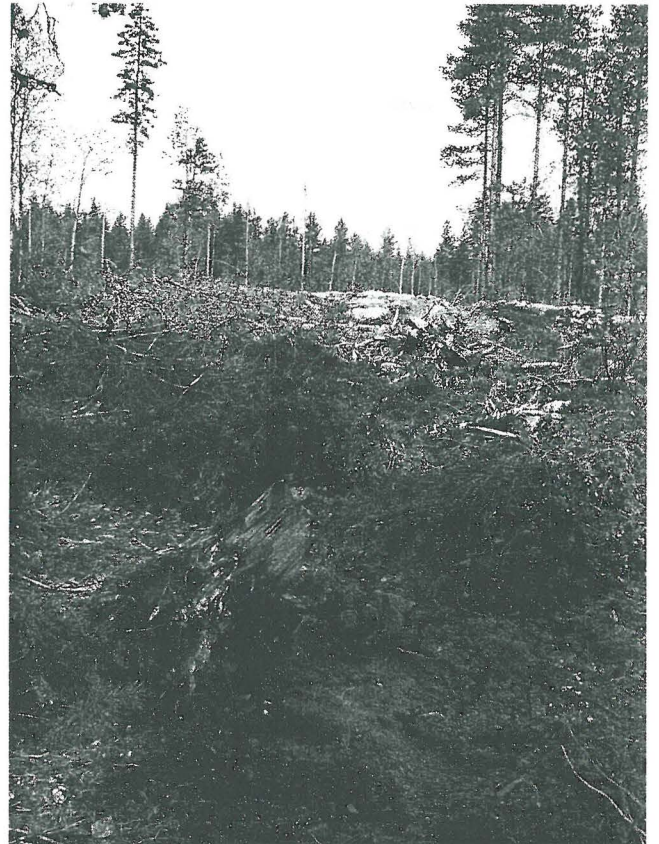
Punaiseksi palanutta hiekkaa asuinpaikan lounaisreunalta. Paikalla myös palanutta kiveä ja kvartsia.