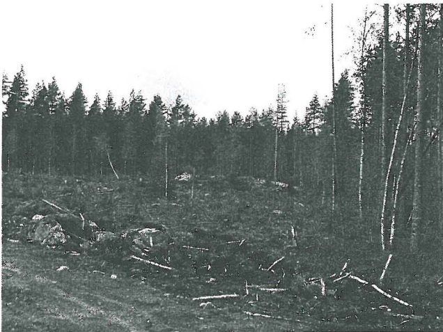
Yleiskuva idästä. Asuinpaikka kankaan reunalla kalliopaljastuman kupeella.