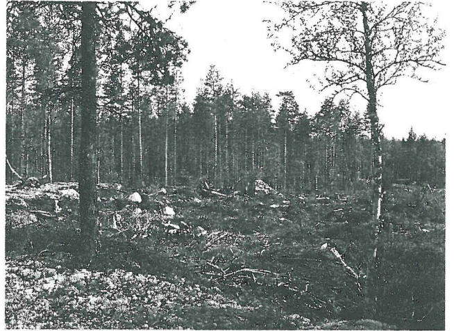
AS´suinpaikka-aluetta lounaasta. Havainnot äestetyltä alueelta kivikon lomasta vasemmalla olevan kallion vierestä.