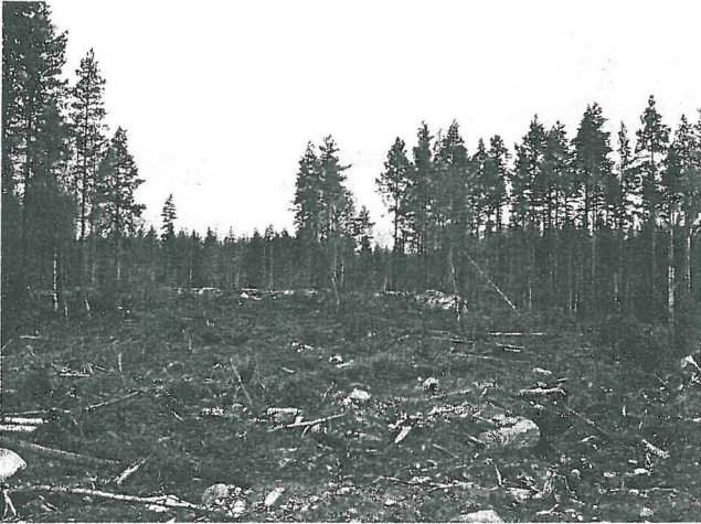
Yleiskuva kaakosta metsätien uudelta tiepohjalta. Asuinpaikka kalliopaljastuman edessä