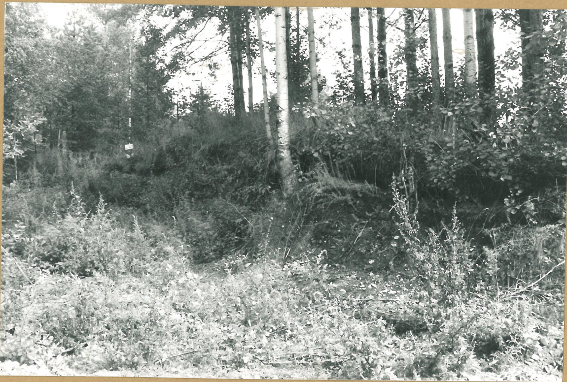
9. Sama kuin nro 7. Kun louhatta