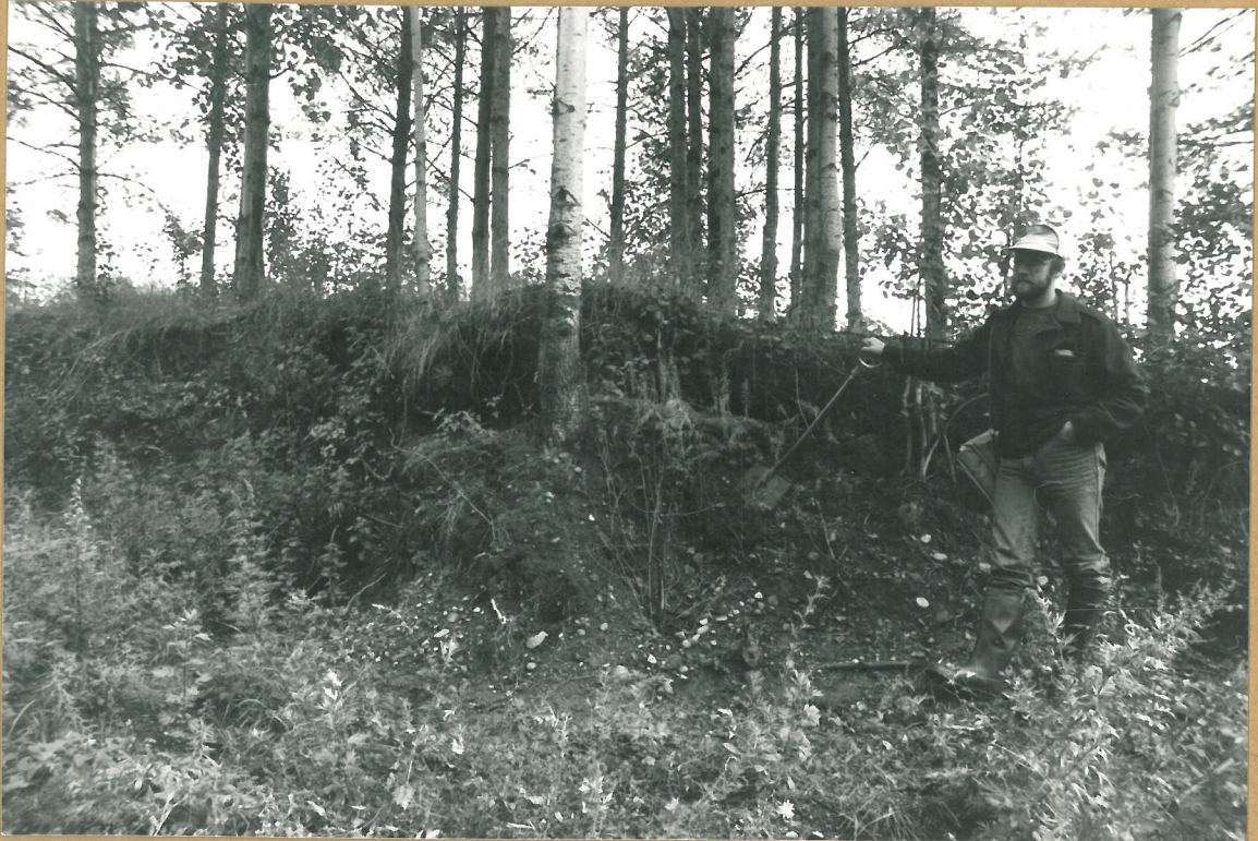
7. Sorakuspan heunaa n. 15 m pohjoiseen 1985 kaimusalueesta. Kuva lännestä.