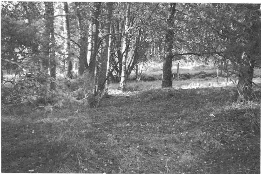
Kuva 3. Tieraunio. N-S. (f. 136040).