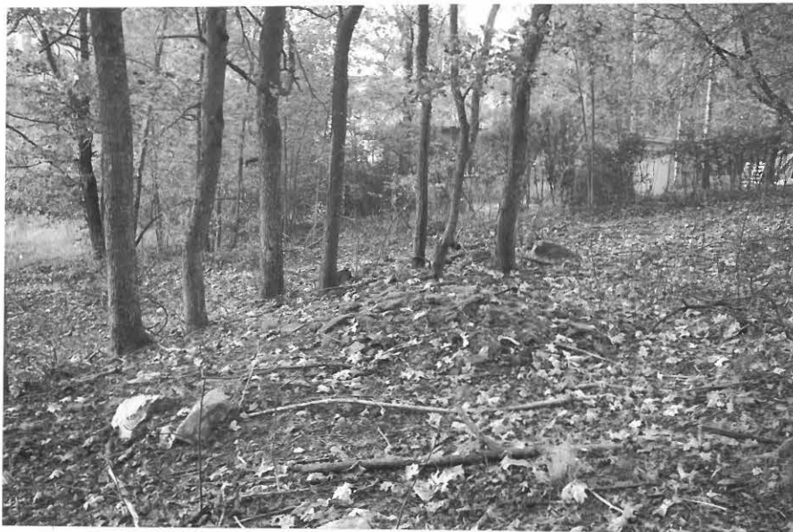
Kuva 2. Liesikumpu metsässä. SE-NW. (f. 136039).