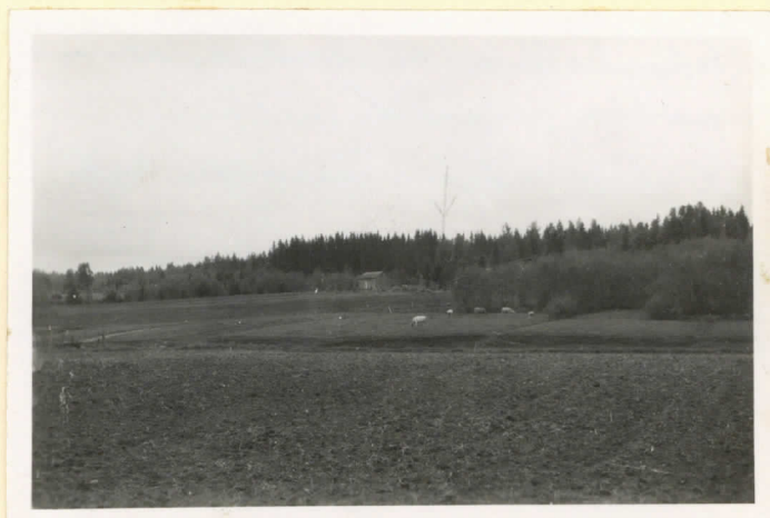
Öskonkallion kivik. asuinpaikka pohjoisesta nähtynä