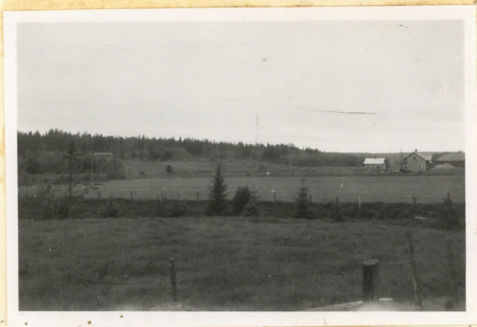
Öskonkallion kivik. asuinpaikka idästä nähtynä