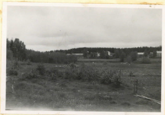
Öskonkallion kivik. asuinpaikka etelästä nähtynä (joen toisella puolella kuvan keskustassa näkyvät Parkkilan tilan rakennuksia.)