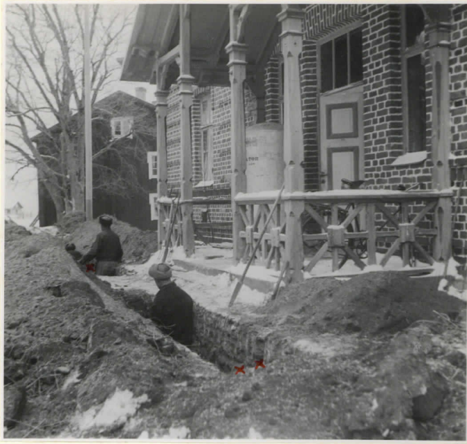
4. x = hauda I ; xx = hauda II.