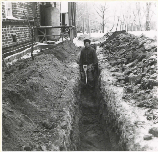
5. mies seisoo haudan n:o I kohdalla.