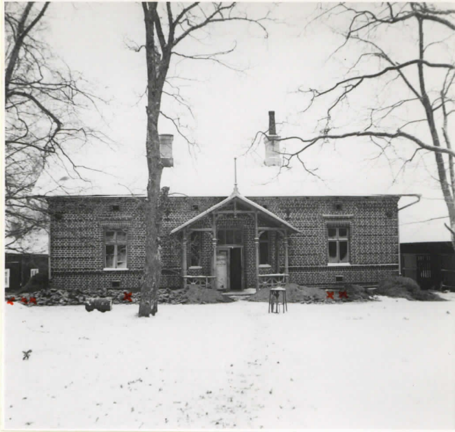
1. "Vanha meijeri". Köyliö 10751. x = huone I xx = huone II, xxx = huone III.