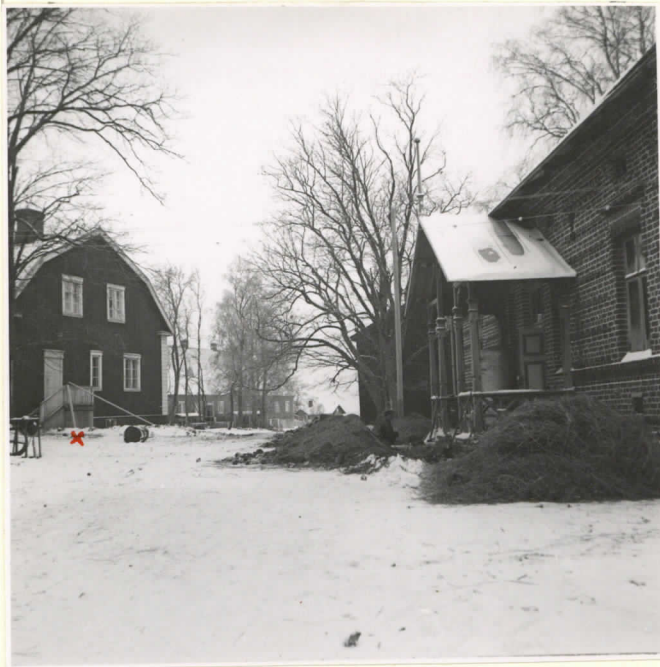
2. Oikealla kaisanto, jota löydät 10751:8-22 x = eineiden 10751:5-6 l.p.