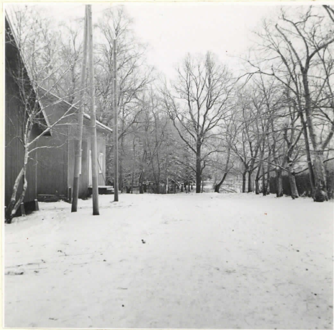
7. Näköala kalnistopaikalta lte lään.