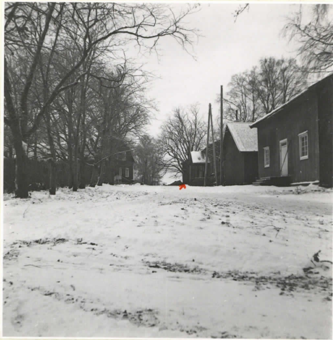
3. ↗ = kalmito (Köyliö 10571).