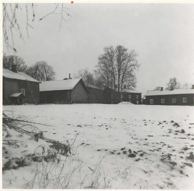
8. Kalnistopaikka SE-suunnasta valokuvattu.