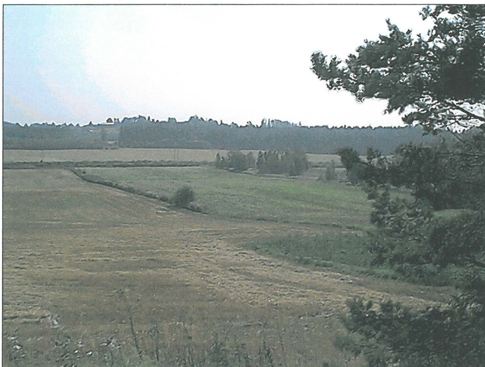
Asuinpaikkaa peltorinteen yläosassa oikealla. Kuvattu vanhalta kuutostieltä etelään.

Valokuvia. Luumäki Ontela.