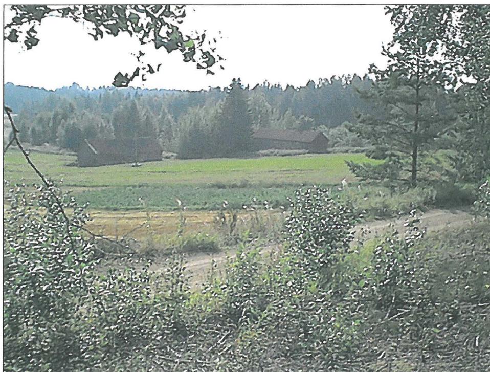
Ontelan asuinpaikkaa kuvattuna lounaaseen kuutostien tiepenkereeltä. Edessä vanha kuutostie. Asuinpaikkaa kuvan keskellä tummevana näkyvässä perunapellossa.