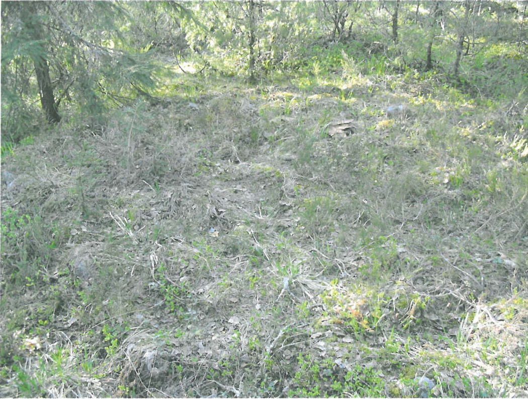
Jatulintarha, kuvattu kaakosta