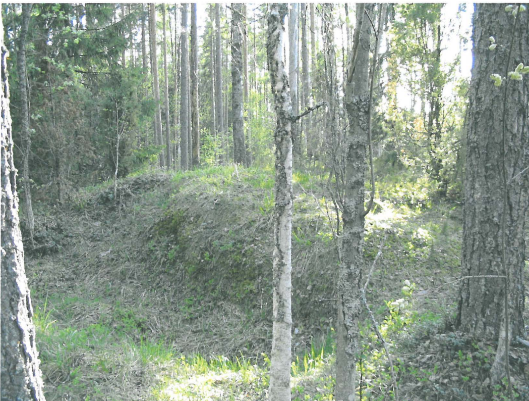
Kalliotasanne, jonka päällä jatulintarha sijaitsee, kuvattu pohjoisesta