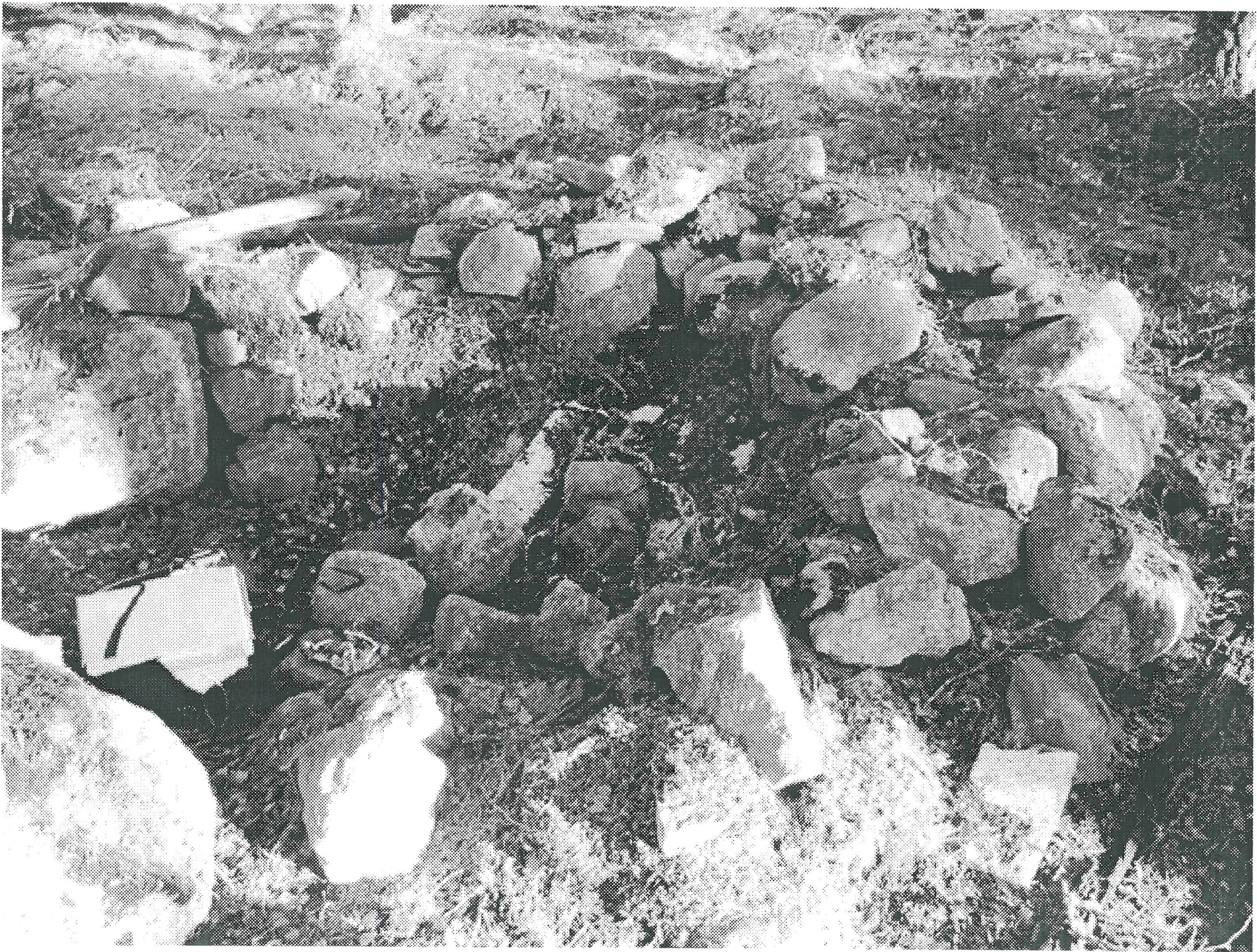
Kuvakatsokse 3. Kivivallin luovutuksen kohteesta.