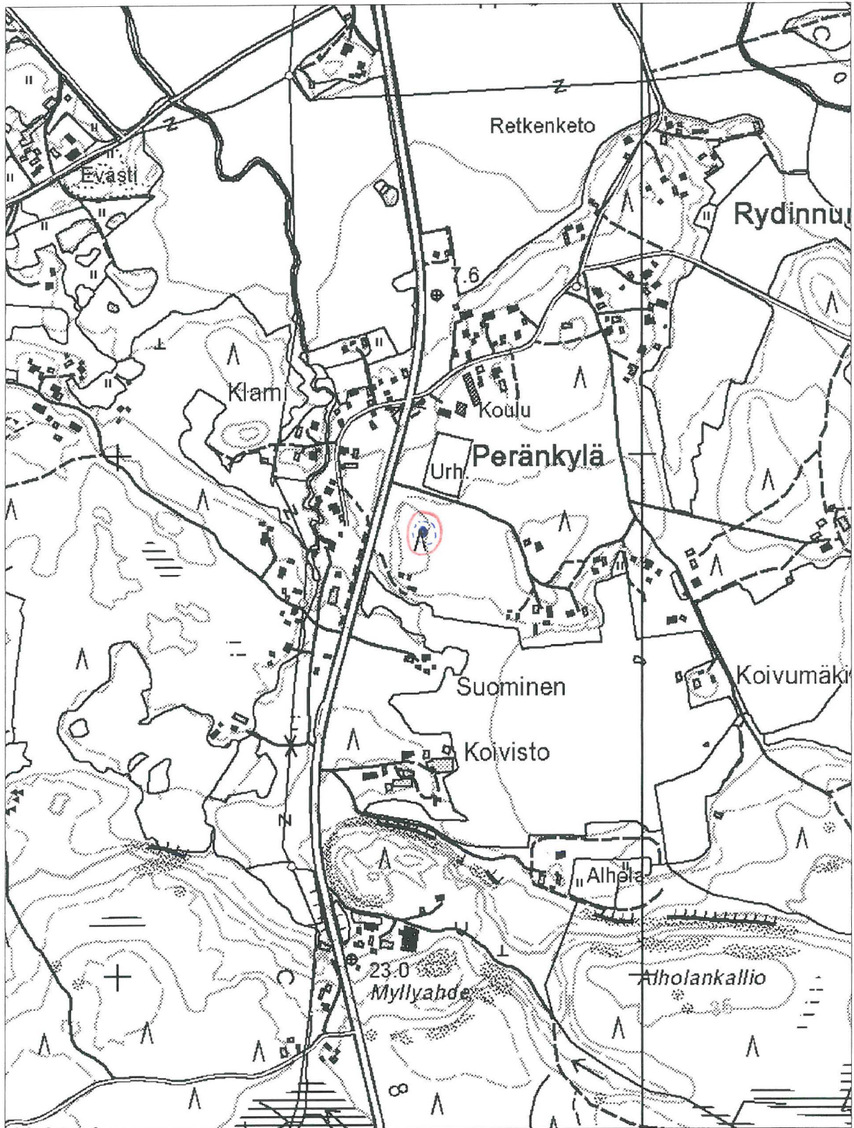
Peruskarttaote 1141 10 Luvia MK 1:1000