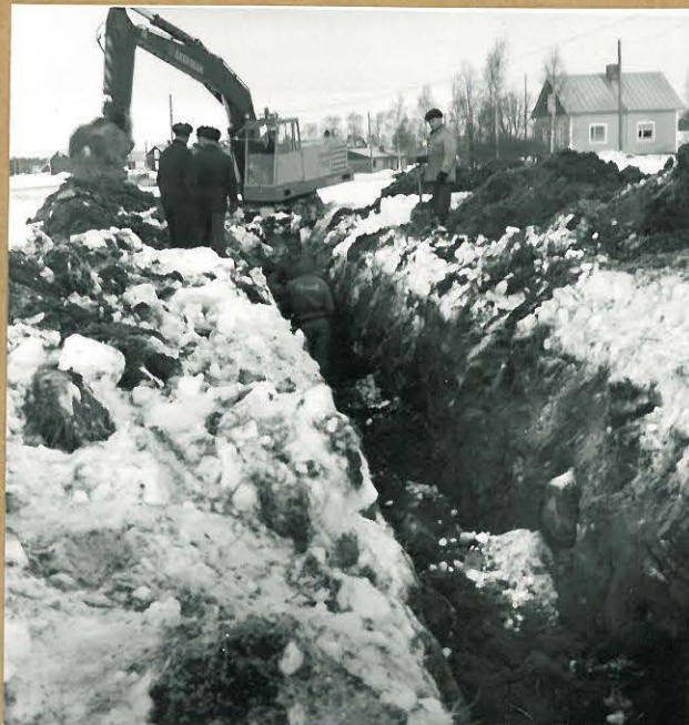
Traompana Kopperbackenin kalmistoaluetta. Etualalla vesijohde- kaviranto. Kuvattu eteläkunaasta.