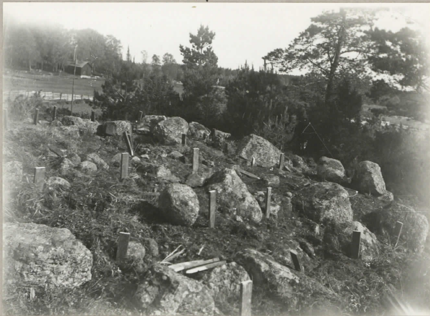
5. Rösen före undersökningen, sett fr. N.W. pl. 8028.

Laitila. Syttyä 2 . Tammamyllymäki. 2 1931.