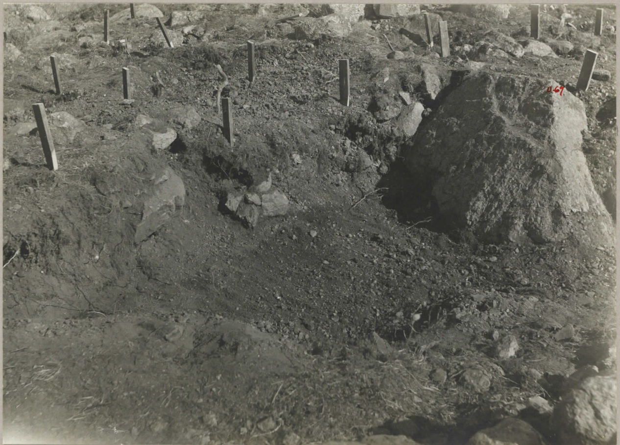
6. Rösets nordvästra avsnitt under pågående undersökning, pl. 8000 A. sedd fr. N.W.