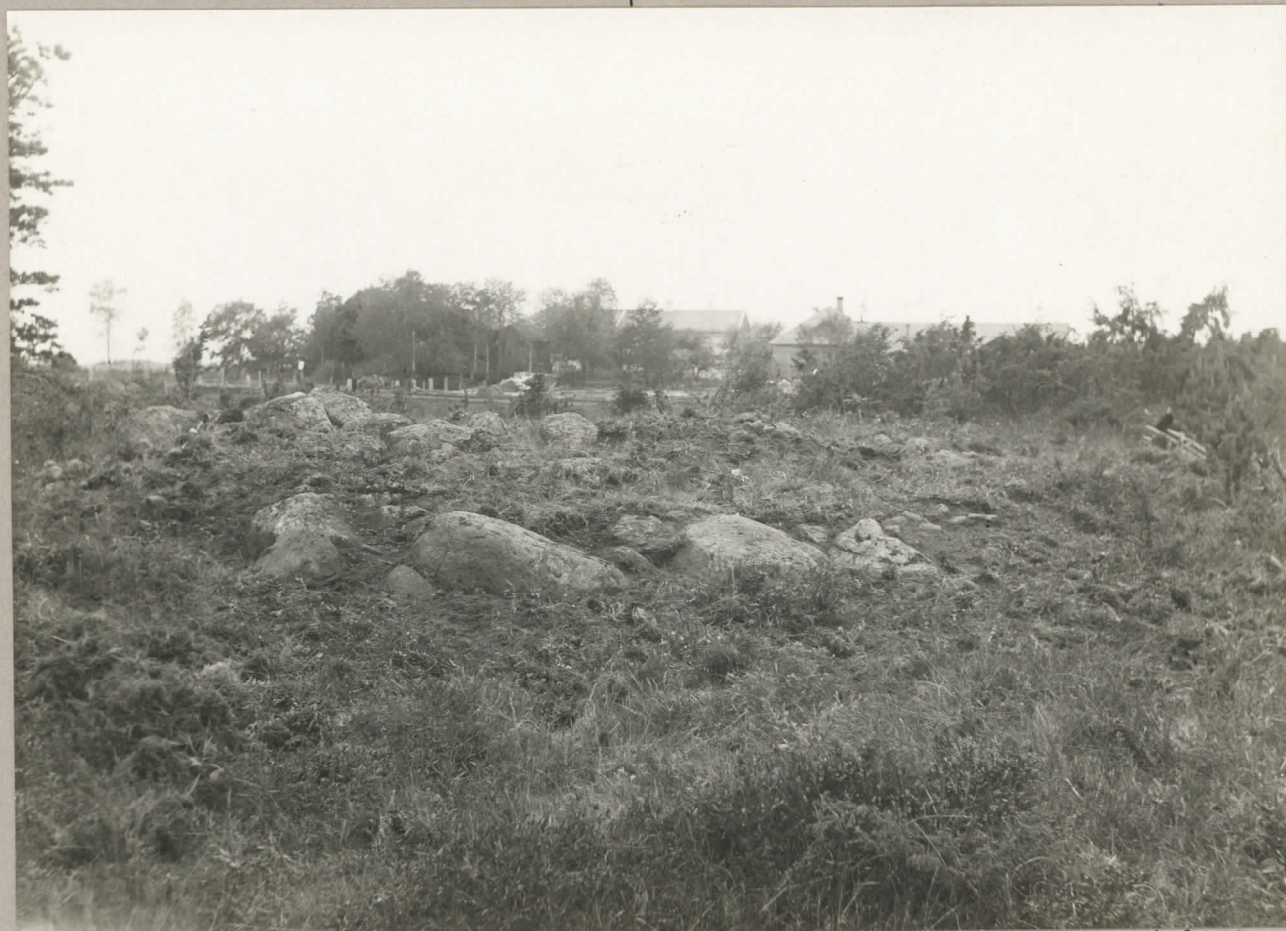
3. Riset på Vanha myllymäkis södra udde, sett fr. S. 8000.