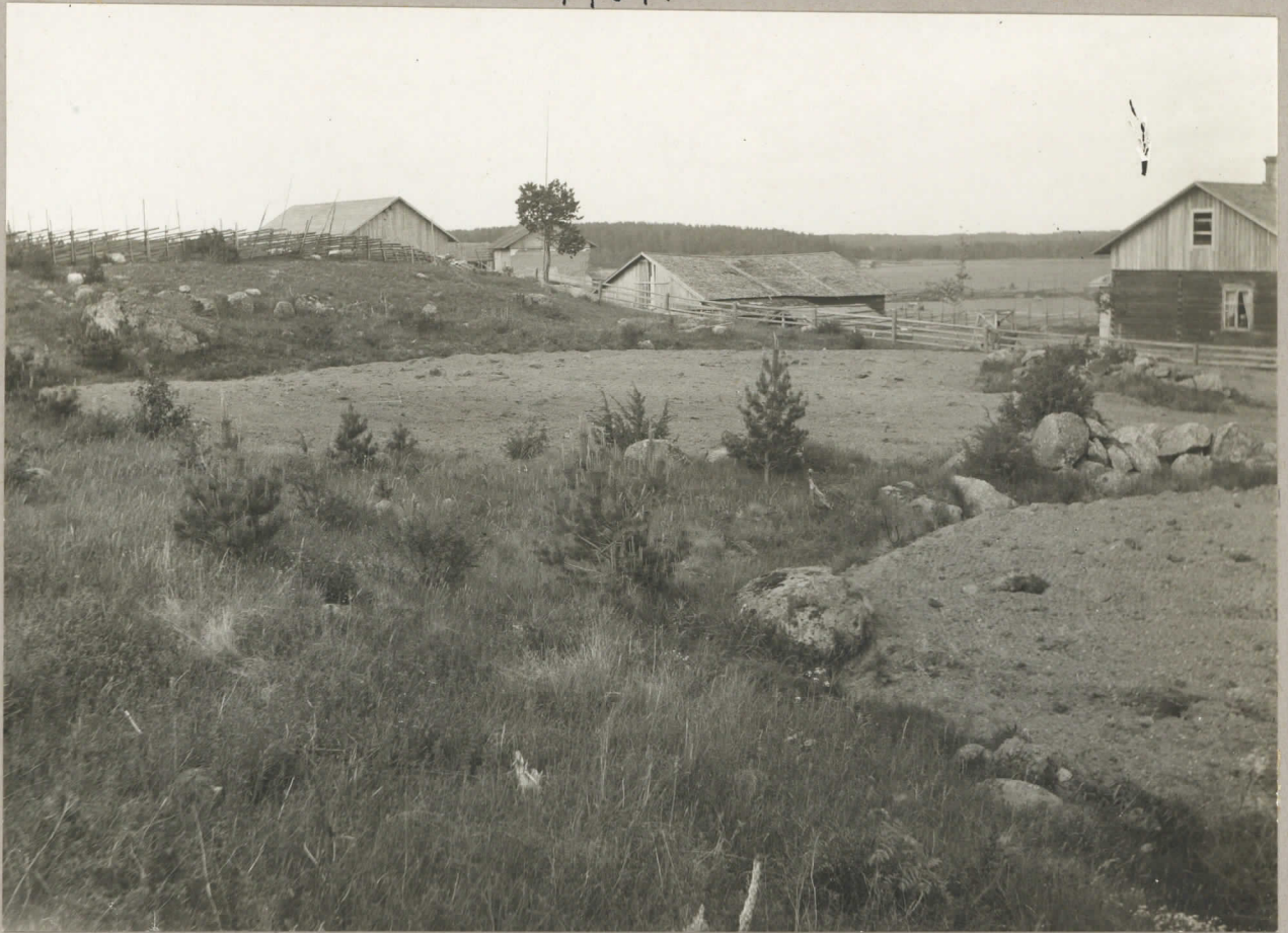
1. Nordöstra delen av Vanha Myllymäki med Varjo nr. 8005. torps åbyggnader, sedd fr. S.W.