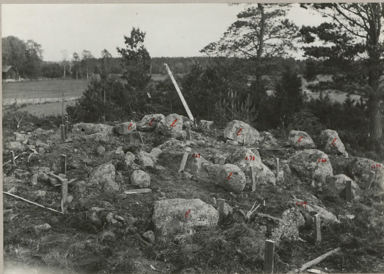
4. Riset före undersökningen sett fr. N.W. & betecknat lös sten. 8001.