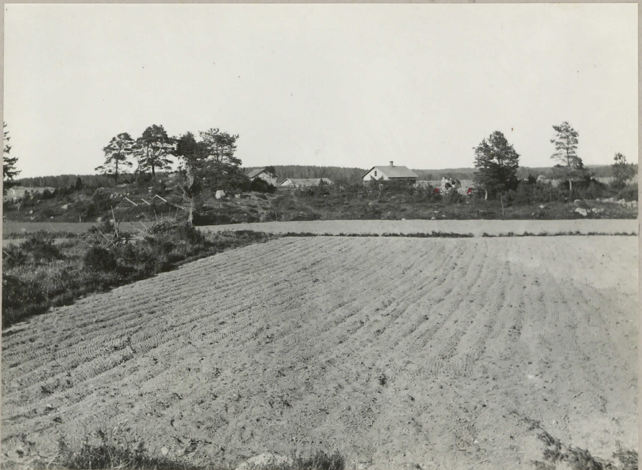
2. Västra delen av Vanha Myllymäki, sedd fr. W. nr. 7999. Torps Varjo torp. Vid x x det undersökta röset.