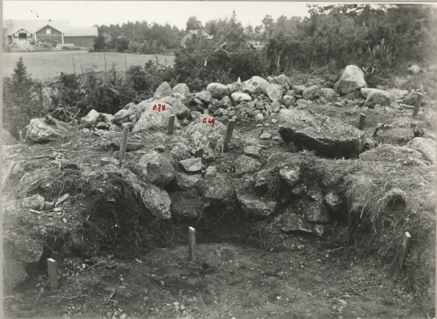
9. Rösen sydvästra avsnitt under på- gående undersökning. nr. 8029.

Laitila. Syttyä 2 Vanha Myllymäki. 1931.