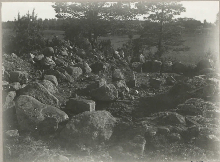
10. Rösen södra hälft under pågående undersökning. nr. 8030.