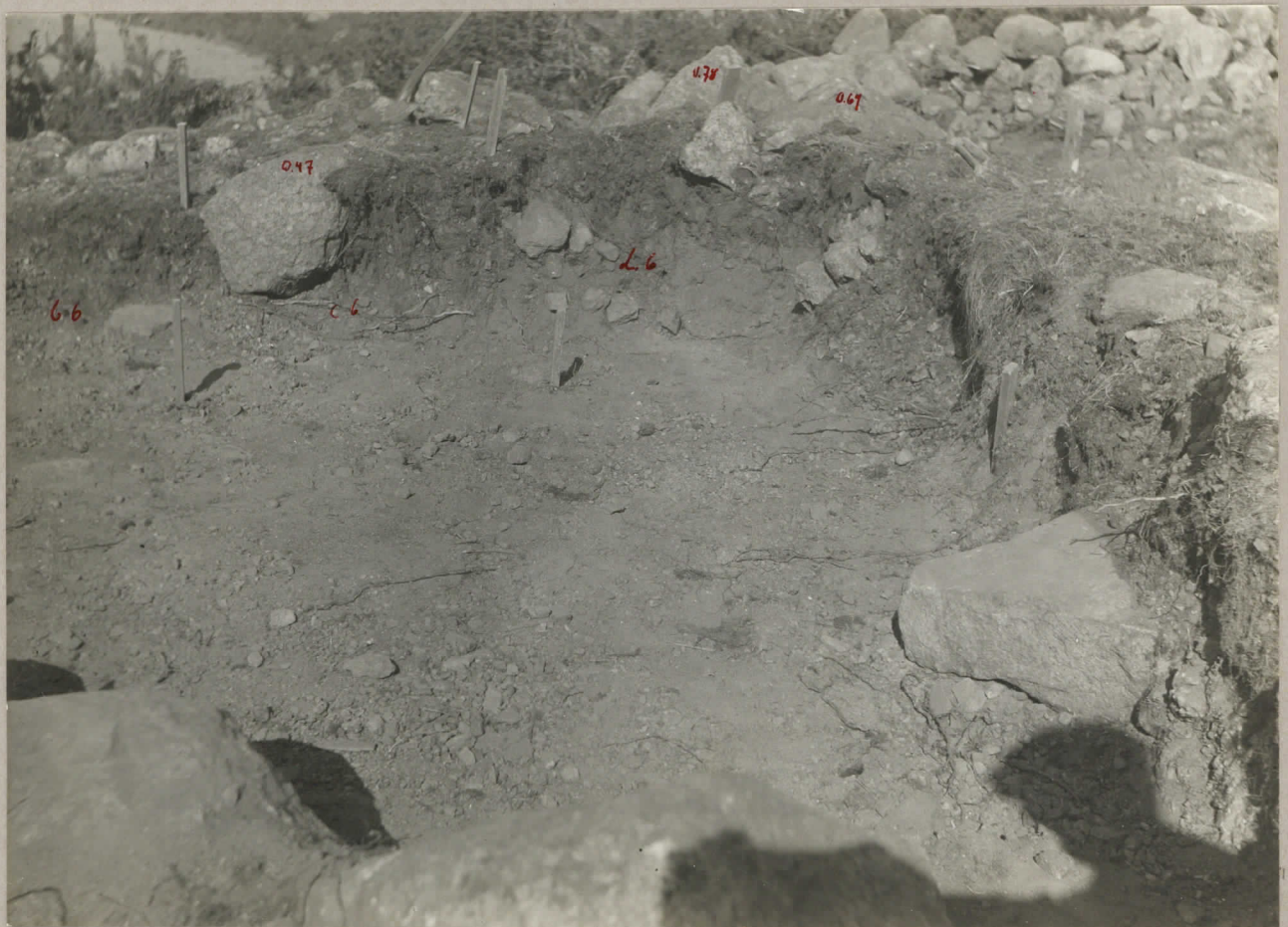
8. Rösens sydöstra avsnitt under pågående undersökning. pl. 8003.