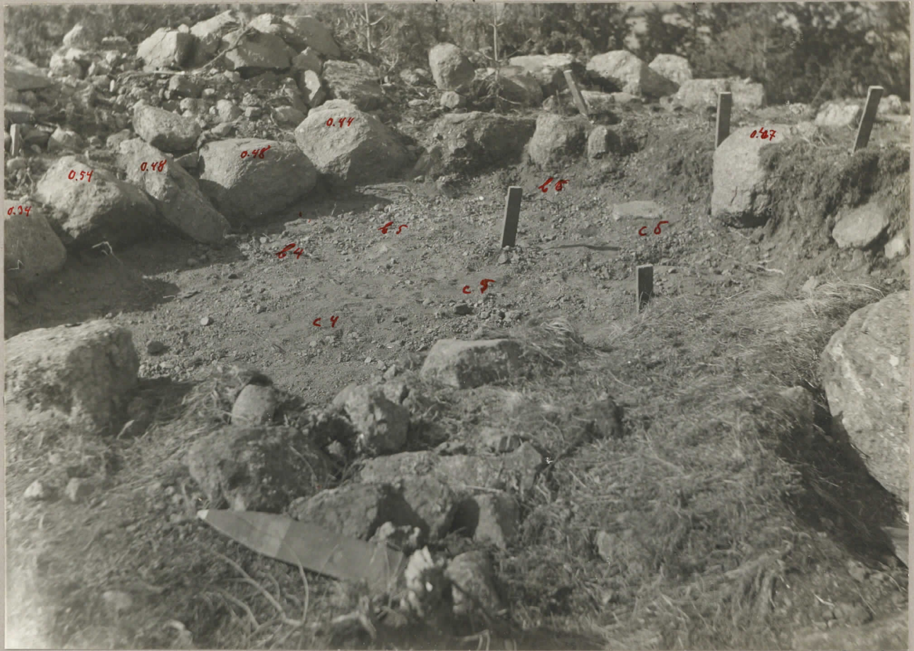
7. Rösens sydöstra avsnitt under pågående undersökning. pl. 8002. stenarna 0.34 (n. 3), 0.54, 0.48, 0.48 (r. n. 4, a4), 0.44 (r. a5) synliga.