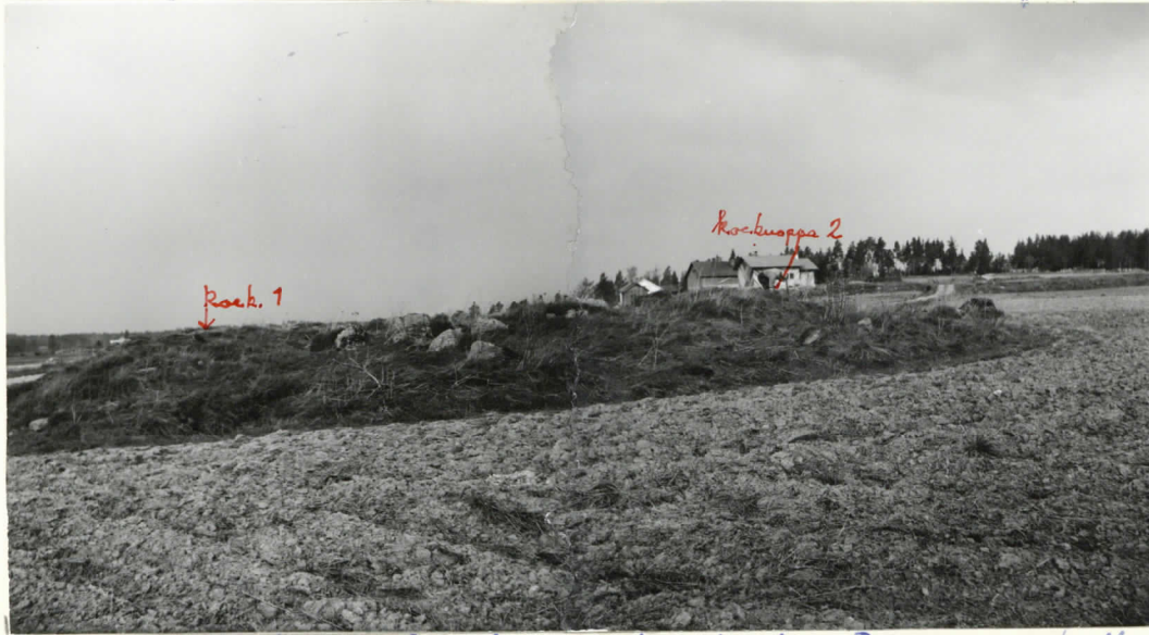
Raunio 7. Taustalla Pohjalaisen rakennukset. Raunio 3 oikealla. Palttilan kartanon mdat ovat tien oikealla puolella.