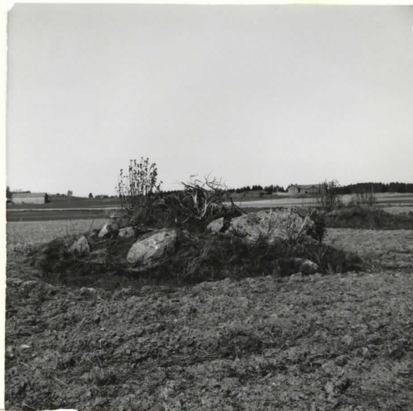
Etuosalla saunio 5. oikealla taustalla saunio 6 (ei hausta)