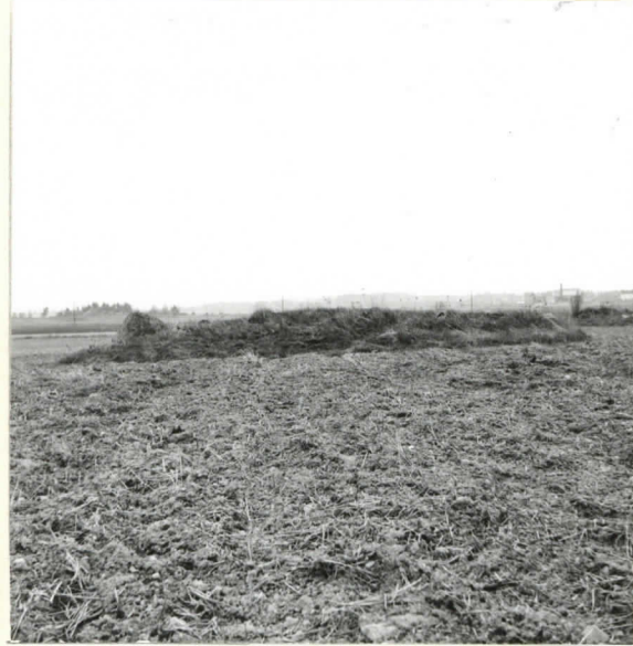
Palttilan pelto, saunio 4. oikealla saunio 5.