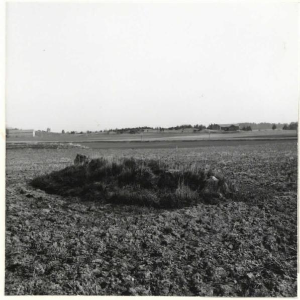
Saunio 4. Taustalla Palttilan kartanon pihka-alue.