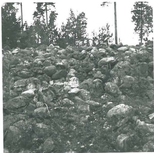
Sama kiviraunio kaakosta kuvattuina.