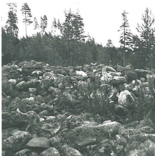
Sama kiviraunio luoteesta kuvattuina.