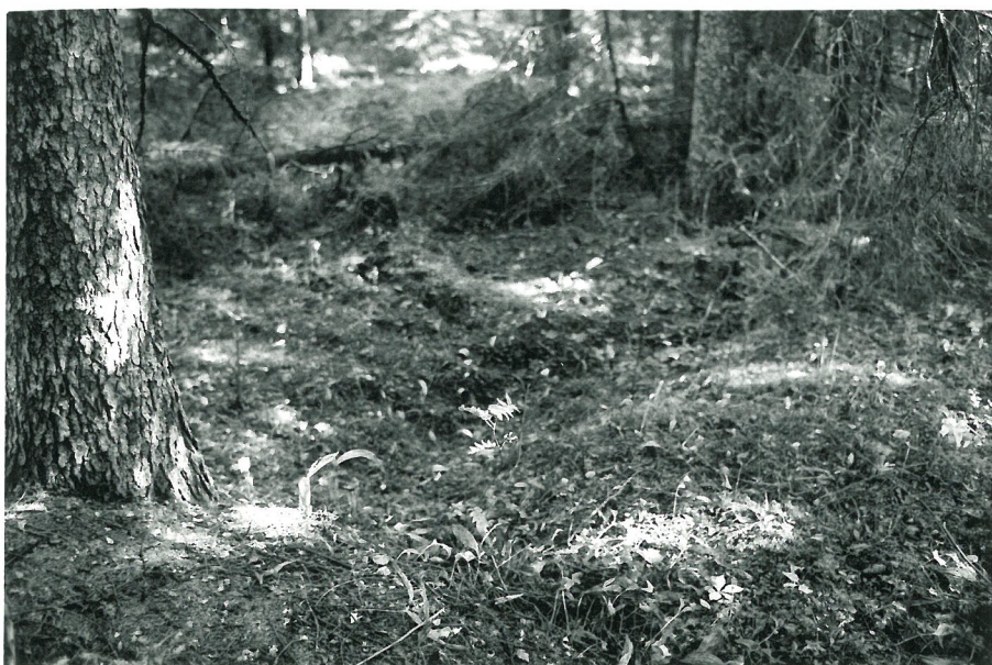
Lounaisrinne, kuoppa nr. 1. Lounaasta.