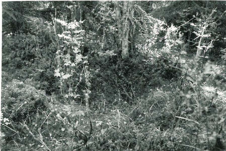
Nubiás knoppa röykkiöstä kaakkoon.