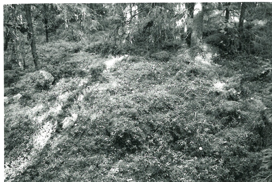
Ranni nr. 7 etelästä.