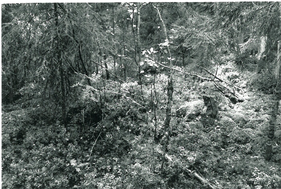
Röykkiö nr. 4. Kuva pohjoisesta.