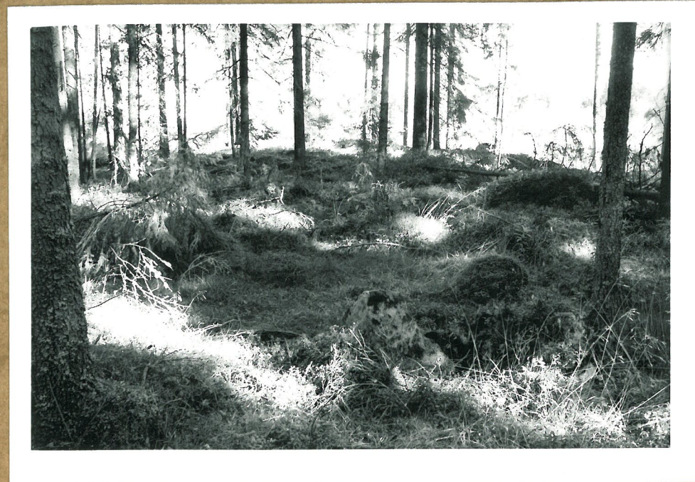
Mahdollinen banttakivi keskellä etualalla. Röykkiö nr. 2 taustalla. Kuva lounaasta.