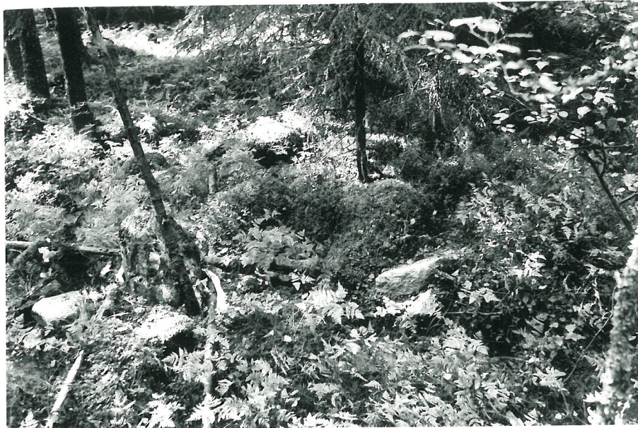
Mahdollinen kyykkis nr. 5 idästä.