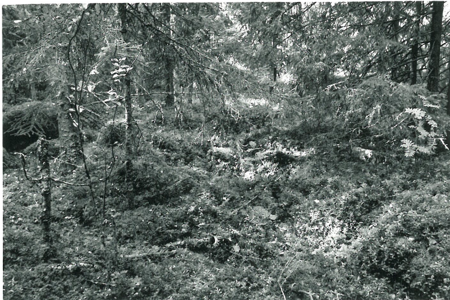
Röykkiö nr. 3 idästä kuvattuna.