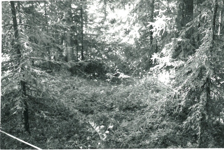
Ensimmäinen knoppa röykkiöstä kaakkoon