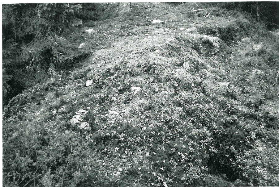
Hanturanni nr. 6 etelästä.