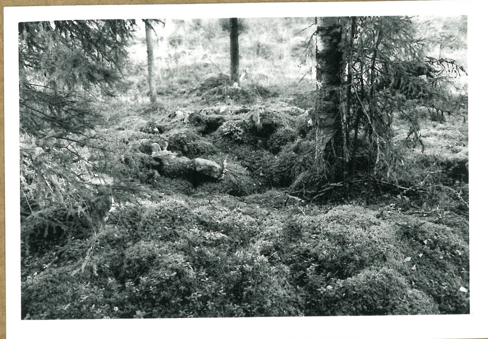
Röykkiö nr. 2 lounaasta. Lähikuva.