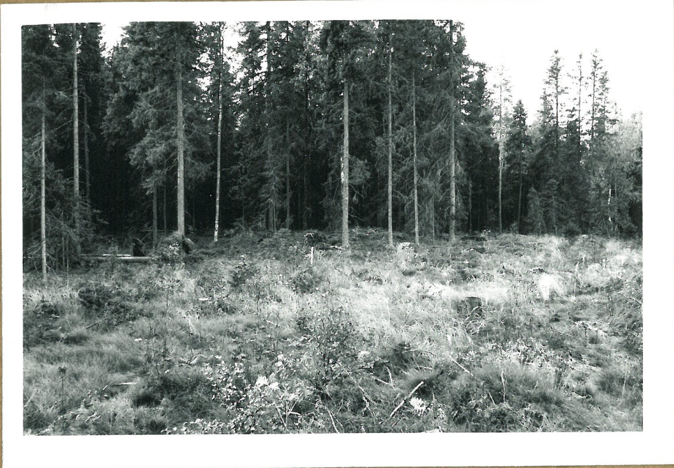
Röykkiö nr. 2 ympäristöineen. Kuva otettu idästä.