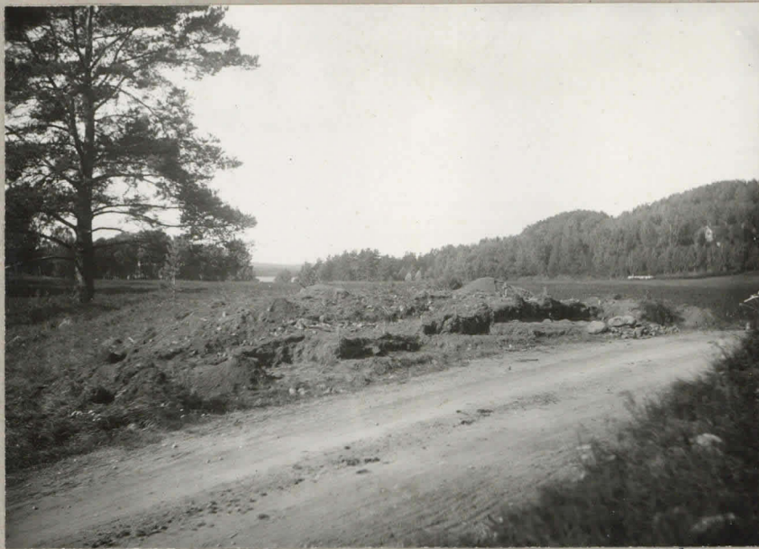
2. Kaivausalue Tausassa, keskellä Orma- järvi, jonka rannalla "miekkamonta- kivi", oikealla Gammelgårdin kartanon päärakennus. 29159.