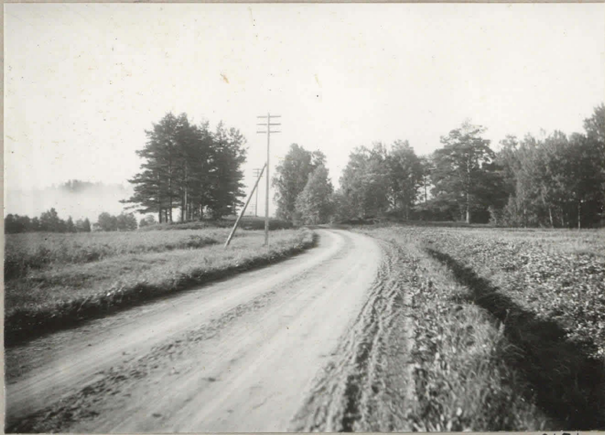
1. Kalmistokumpu NNW-suunnasta 9151. valok. Tausassa oikealla Tuulimyllymäki.