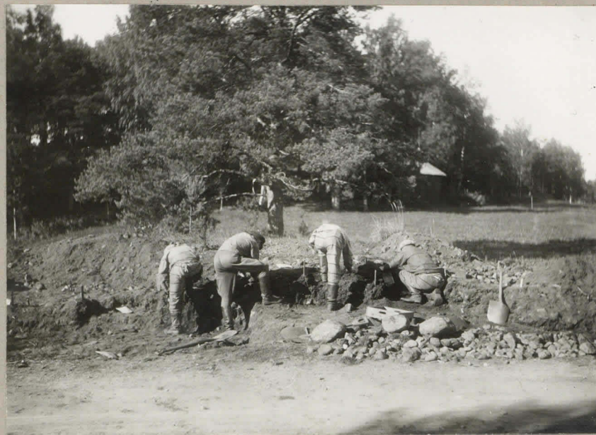
3. Pakkopyörittöksen niemet muinais- tieteellisissä kaivauksissa. 9153.