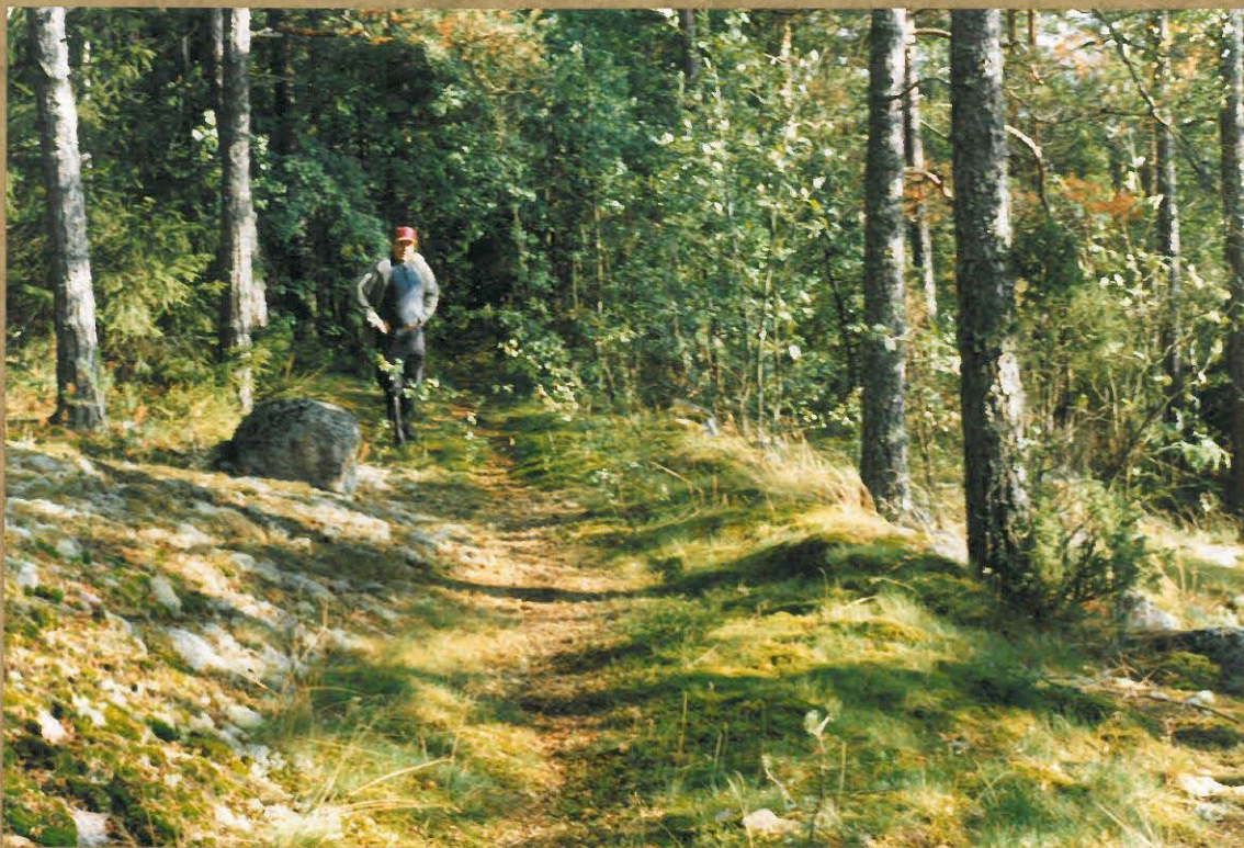
ANTI KOLHI VIERTOTIELLÄ PAKATULAN MYLLY- VUORELLA.