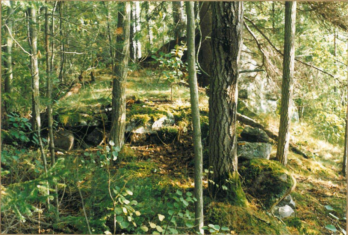
KULMÄMURATUN KIVIRAKENNELMAN MU- TEISKÄRKI KUVATTUNA PÖYJÖISLUOTEESTA.