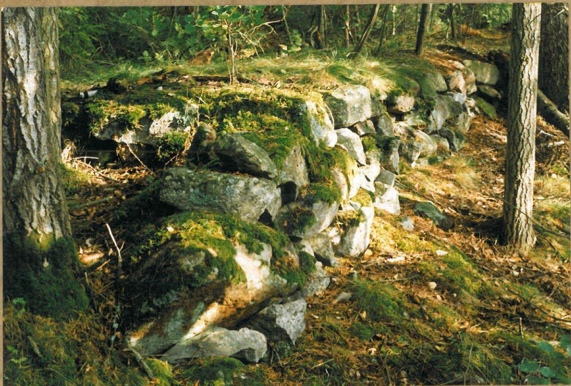
KULMÄMURATUN KIVIRAKENNELMAN MU- TEISKÄRKI KUVATTUNA LUOTEESTA.