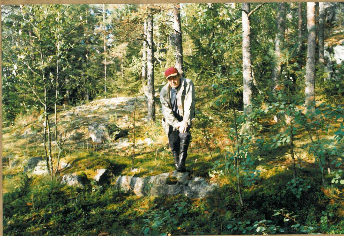
ANTI KOLHI VIERTOTIEN KIVÄENNUKSEN LUONA.