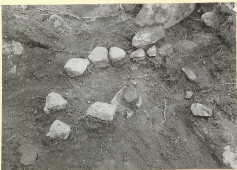
N: 9641 (J. L. 1934) Antasbacherin -asuin- paikan kaivansuunnitelmassa B4 - ollut lieskimäinen ki- veys, joka -soittauttuni- kyärikäiseksi, sillä ma- sen -alla oli liikuteltua.