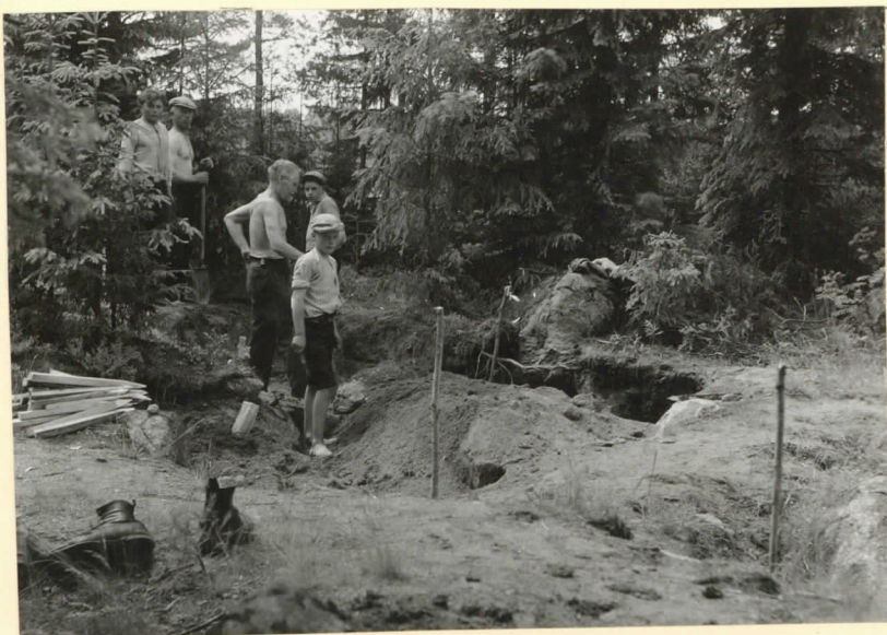
N:o 9640. (J. L. 1934). Antasbacherin asuinpaikan muutuja B3-4 kaivetaan.