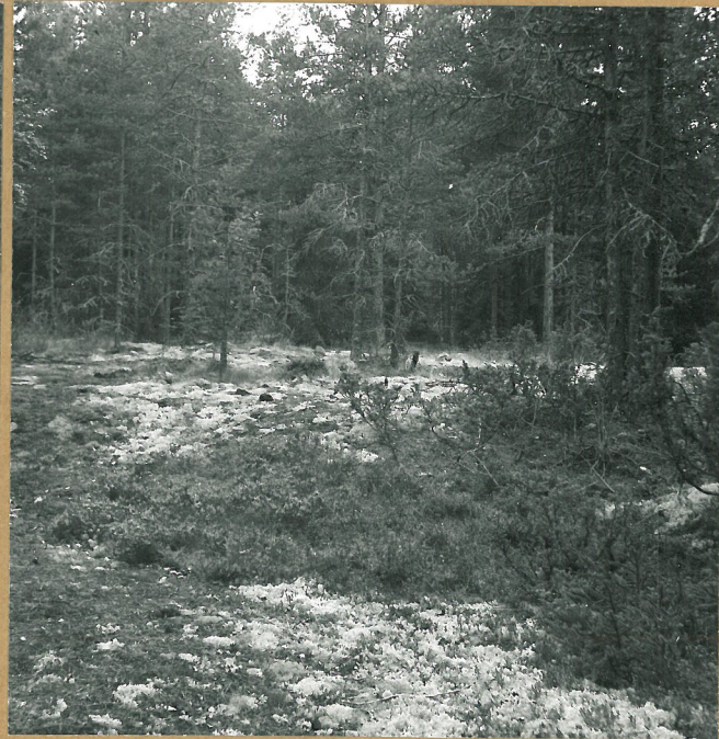
48075 K 3