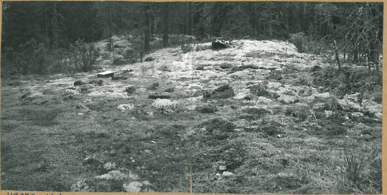
48073 K 1.