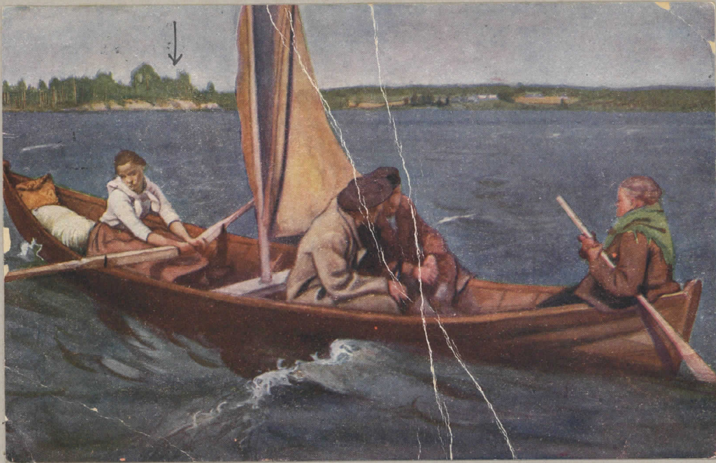
Eero Järnefelt: Kotimatkalla. Nuolen osoittama kohta on Lappeen Mikonsaunan Kivikautisen asuinpaikka.