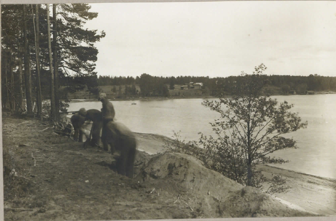
Lappeen Mikonsaunan Kivikautisen asuinpaikan kaivaus WNW-suunnasta. 5/VI 1931.