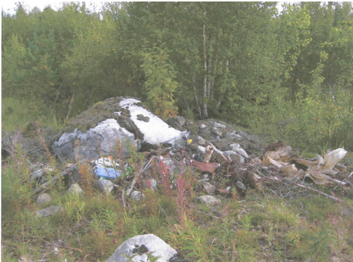
Ehjänä säilynyt, mutta roskan ja romun peittämä röykkiö käsittelyn alueen reunassa. Kuvattu W.