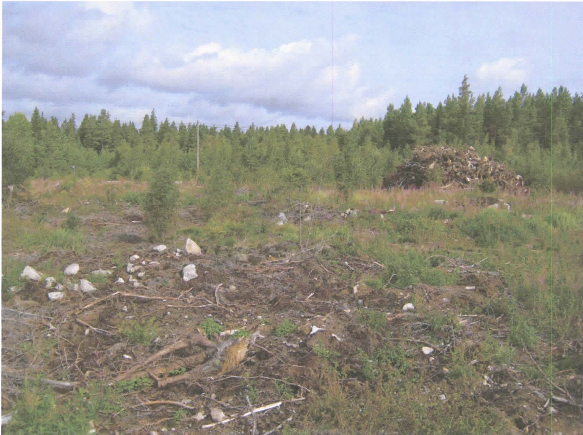
Yleiskuva alueesta. Kuvattu SW, taustalla näkyy Tuorilasta Merikarvian keskustaän menevä tie.