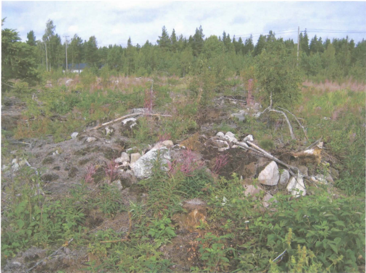
Kannonnostossa osittain tuhoutunut röykkiö. Kuvattu SSW.