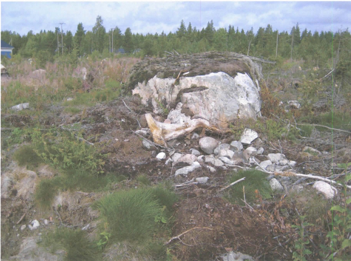
Osittain tuhoutunut röykkiö. Kuvattu S. Vasemmassa reunassa näkyy Merikarvian LVI-tuotteen rakennus.