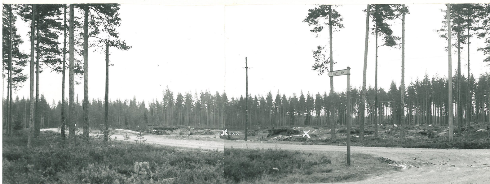
Kuva 1. Kunnan tiekkakuoppa pohjoisesta. Oikealla Korpusen kivien löytöpaikka, vasemmalla Hampulan; pienet ristit osoittavat paikkoja, josta löytyi asuinpaikan merkkejä.