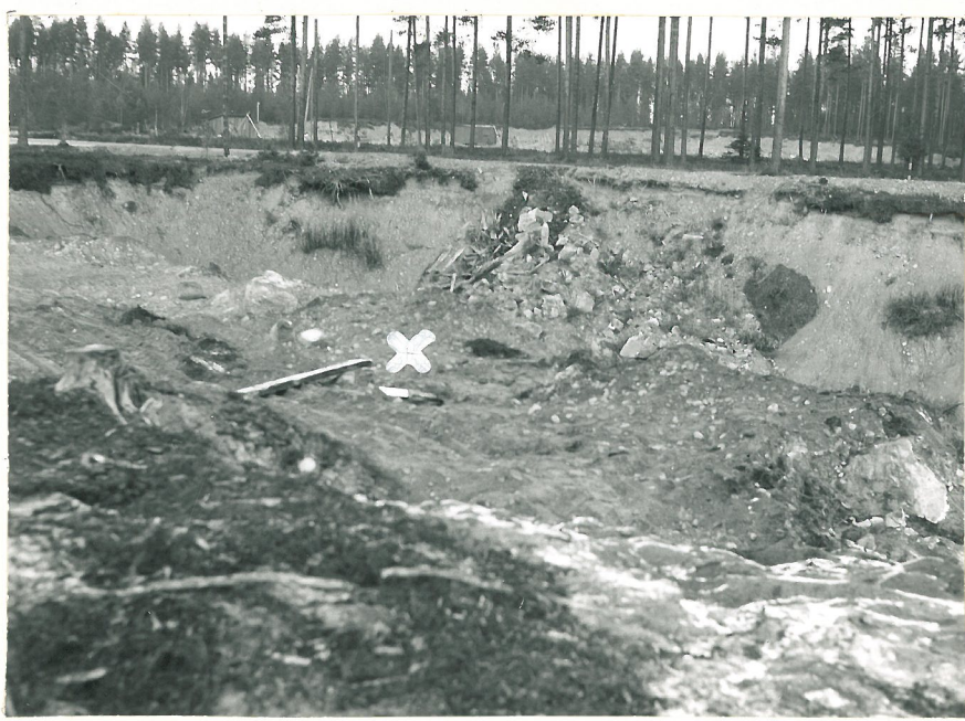
Kuva 2. Korpusen kivien löytöpaikka. Taustalla näkyy valtion tiekkakuoppa.