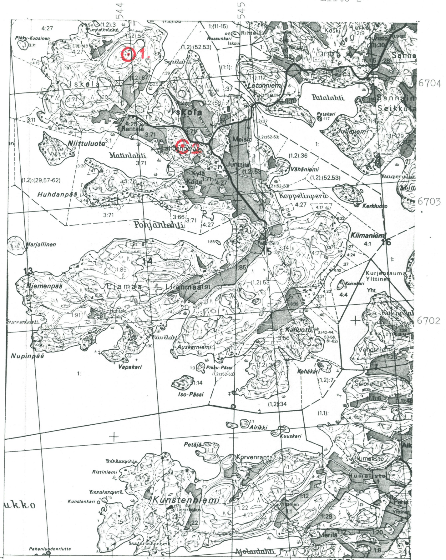
Peruskartta 1043 03 MK 1:20000