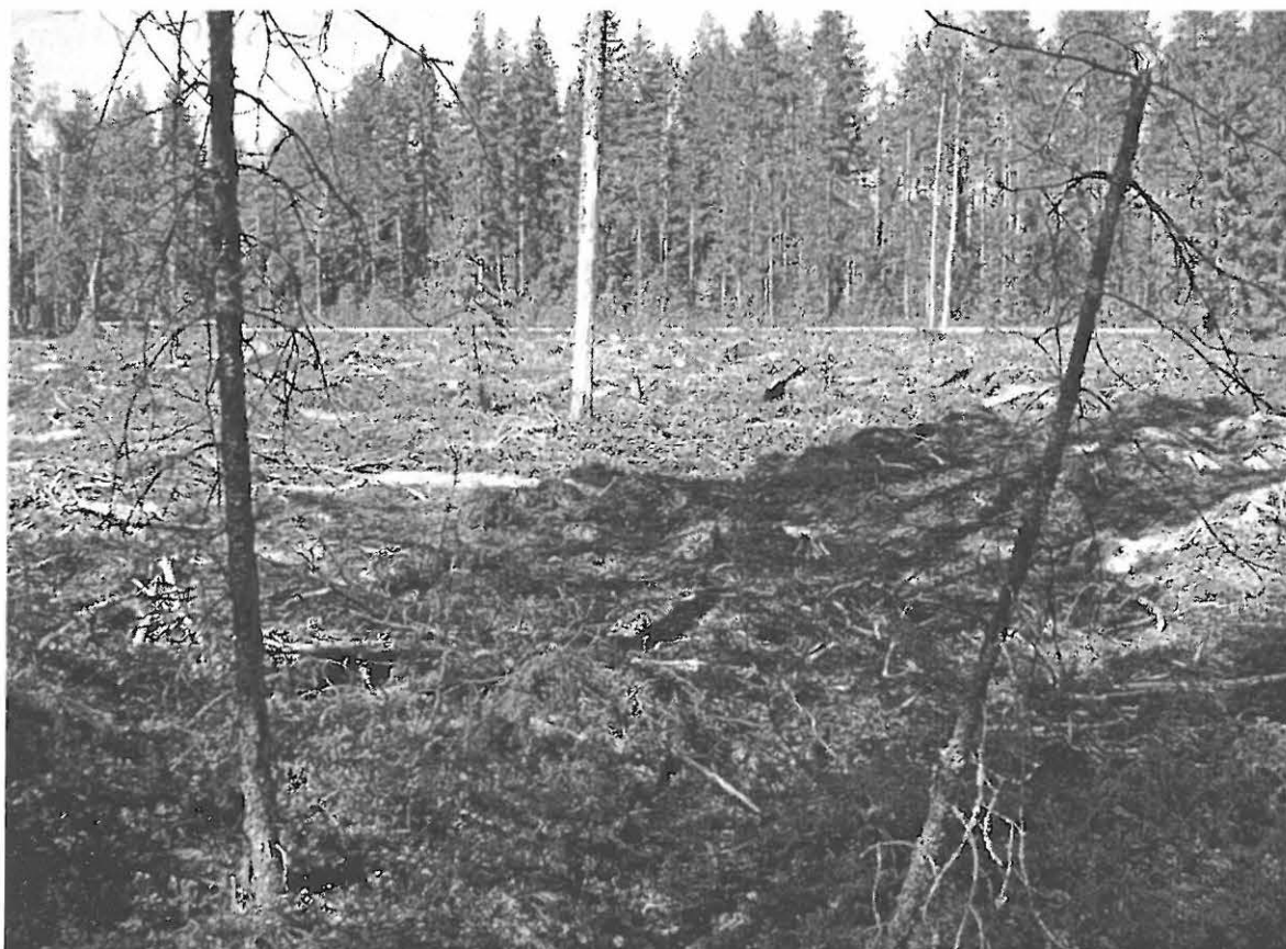
Itäinen painanne etualan kahden näreen ja takana olevan puun rajaamalla alueella. Äestysura kulkee painanteen osin poikki, kuvattu kohti pohjoisluodetta.