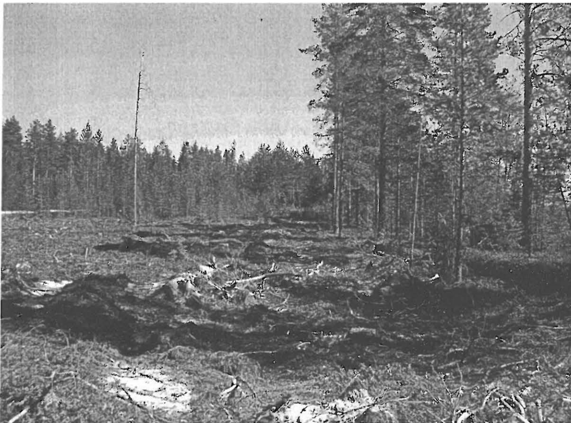
Läntisempi painanne 2 etualalla varjon alla, vasemmalla äestysura painanteen pohjoisreunan poikki. Kuvattu kohti itää.