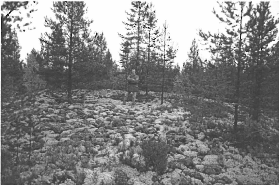
Kuva 2. Muhos Laitasaari Hirsikangas 2. Yleiskuva kivirakasta harjanteen laen suuntaisesti. Rakan keskellä seisomassa fil.yo Vesa-Pekka Herva. Hänestä vasemmalle sijaitseva nuori mänty kasvaa rakkakuopan 2 keskellä (Oulun yliopiston arkeologian laboratorion dia 23845, kuva: Janne Ikkäheimo, suunta 160/360°).