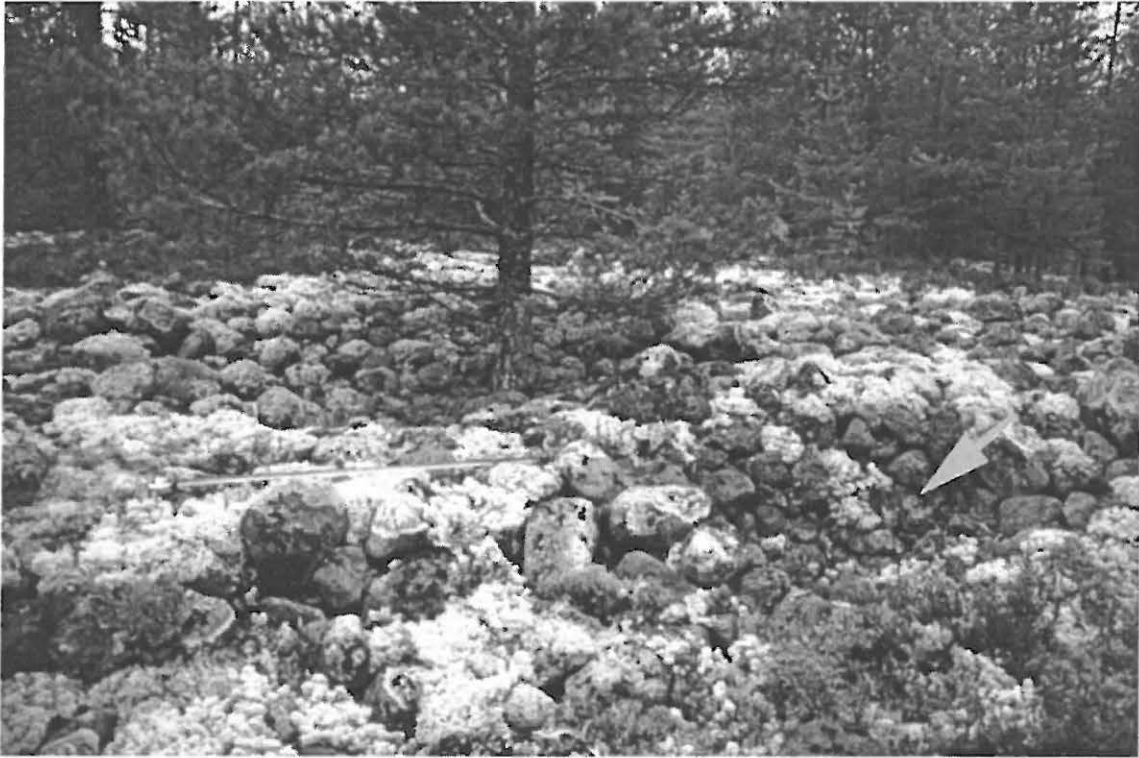
Kuva 3. Muhos Laitasaari Hirsikangas 2. Rakkakuopat 1 ja 2. Kuoppa 1 etuoikealla (nuoli), etualalla näkyvä mänty kasvaa kuopan 2 keskellä. Mitan näkyvän osan pituus on 1 metri. (Oulun yliopiston arkeologian laboratorion dia 23846, kuva: Janne Ikäheimo, suunta 240/360°).