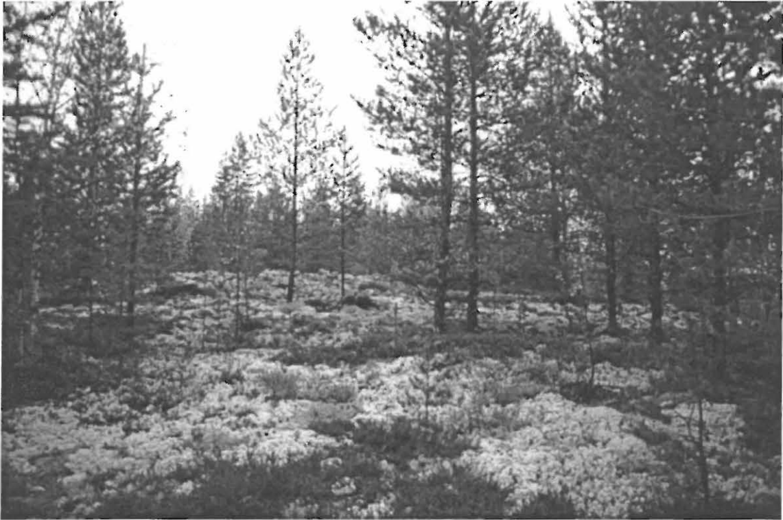
Kuva 1. Muhos Laitasaari Hirsikangas 2. Yleiskuva moreeniharjanteen kaakkoiskärjessä sijaitsevasta kivirakasta (Oulun yliopiston arkeologian laboratorion dia 23844, suunta 10/360°).