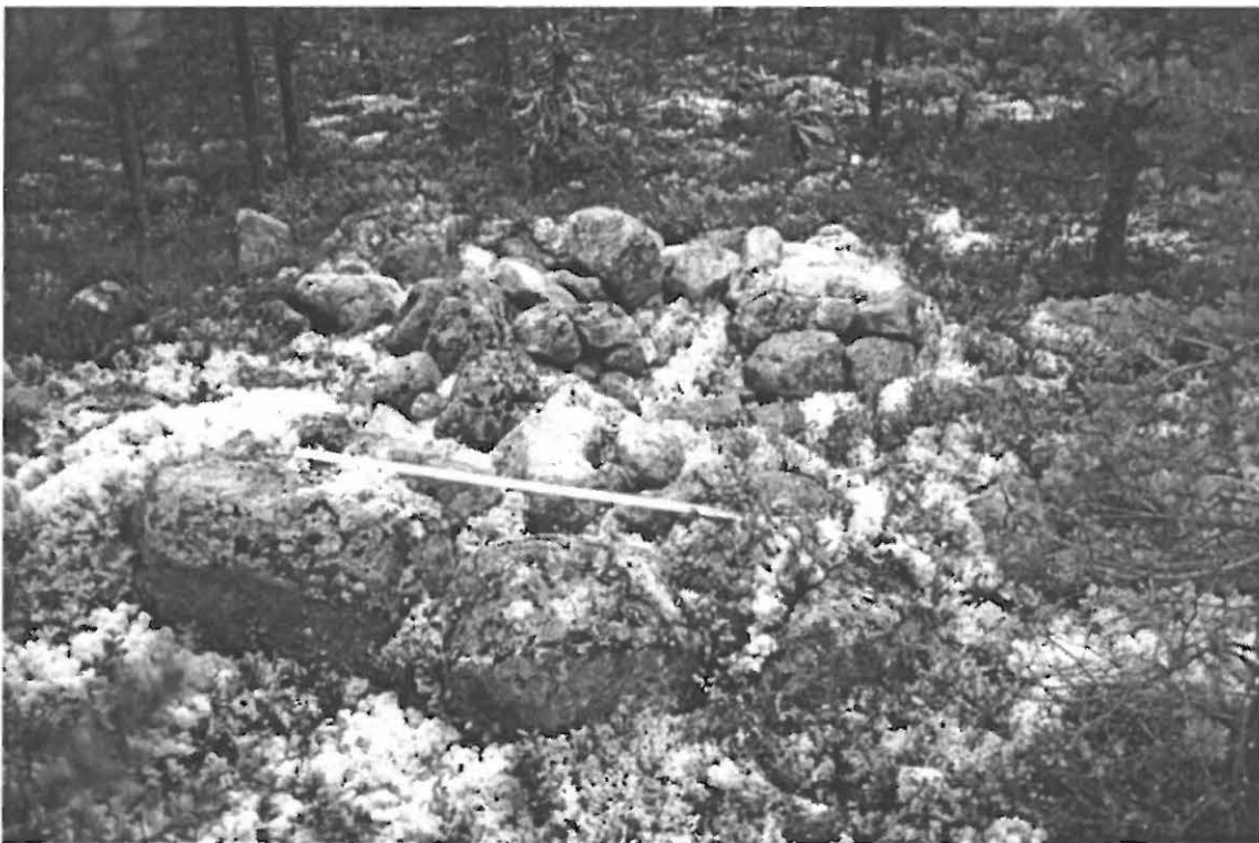
Kuva 2. Muhos Laitasaari Hirsikangas 3. Kiviröykkiö kohti itä-koillista (Oulun yliopiston arkeologian laboratorion dia 23842, kuva: Janne Ikkäheimo, suunta 70/360°).