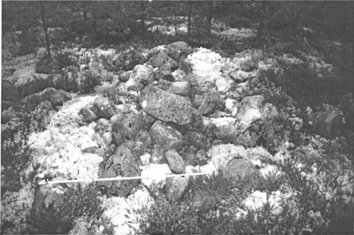
Kuva 3. Muhos Laitasaari Hirsikangas 3. Kiviröykkiö kohti länsi-lounasta (Oulun yliopiston arkeologian laboratorion dia 23842, suunta 240/360°).