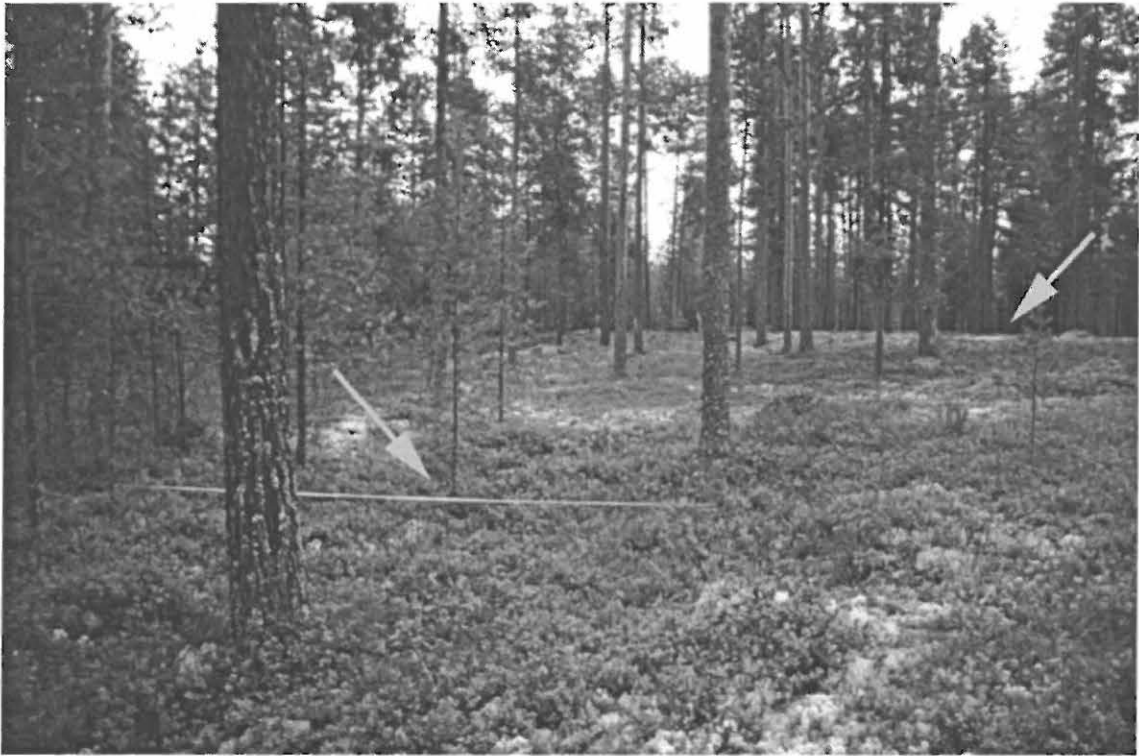
Kuva 3. Muhos Laitasaari Kettukangas. Alarinteessä sijaitseva asuinpainanne edessä (vasen nuoli), suuren painanteen valli takana (oikea nuoli). Kuvattu luoteesta (Kuva: Janne Ikkäheimo. Oulun yliopisto, Arkeologian laboratorion dia 23490).