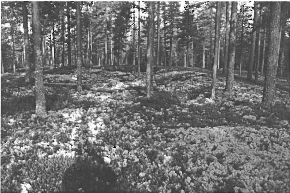
Kuva 2. Muhos Laitasaari Kettukangas. Harjanteen lakea hallitseva, jätinkirkkomaisen habituksen omaava painanne. Kuvattu itä-kaakosta.