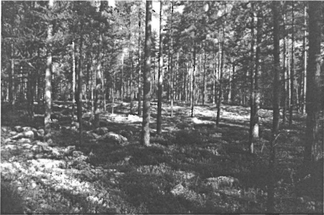
Kuva 1. Muhos Laitasaari Kettukangas. Yleiskuva varsinaisen kankaan eteläpuolella kohoavasta moreeniharjanteesta. Kuvattu etelä-kaakosta.