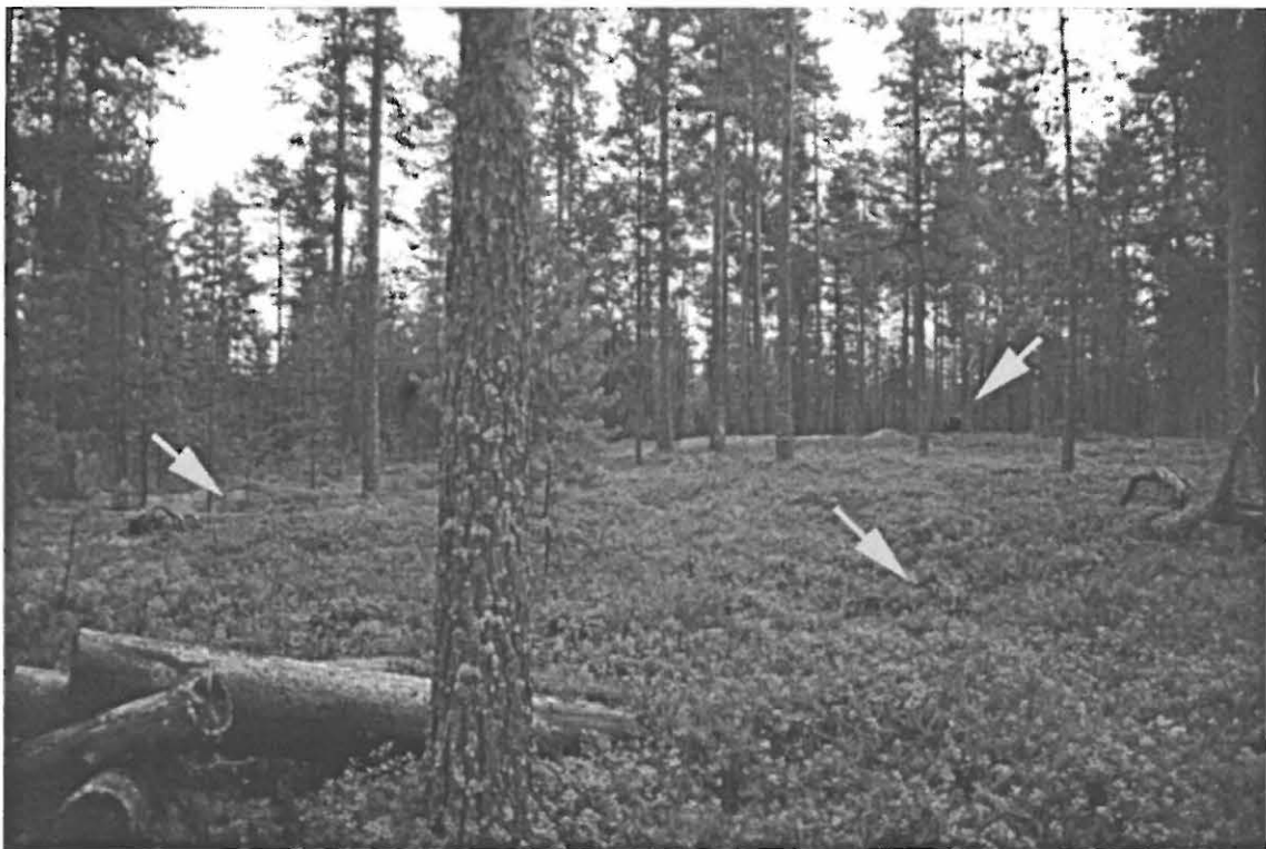
Kuva 4. Muhos Laitasaari Kettukangas. Huonosti erottuva asuinpaikkakuoppa etuoikealla, pienempi asuinpainanne keskellä vasemmalla ja suuri, jätinkirkkomainen painanne takaoikealla. Kuvattu luoteesta (Kuva: Janne Ikkäheimo. Oulun yliopisto, Arkeologian laboratorion dia 23491).