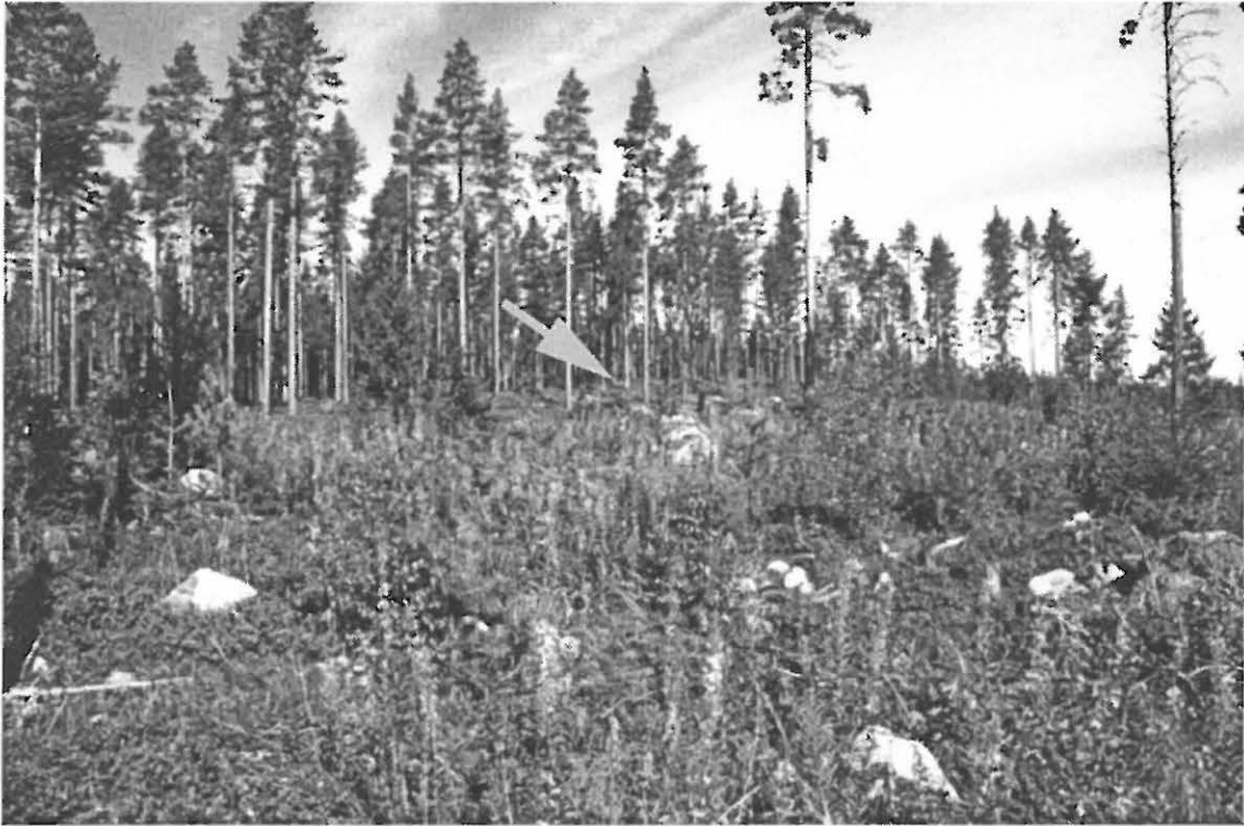
Kuva 1. Muhos Laitasaari Petäjäkangas. Kankaan laen eteläkärki. Röykkiöt sijaitsevat avohakatusalueen takana kohoavassa harvennetussa männikössä, nuolen osoittamalla alueella. Kuvaattu etelä-kaakosta.