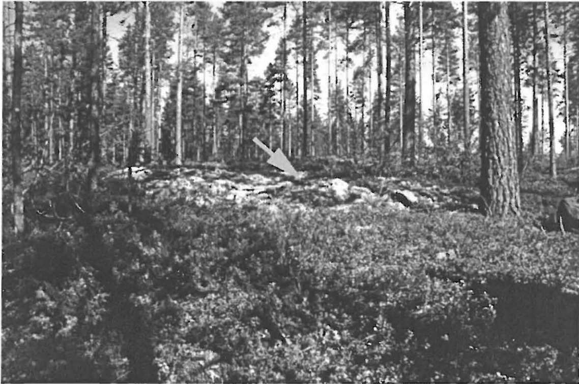
Kuva 3. Muhos Laitasaari Petäjäkangas. Kehäryökkiömäinen rakenne A. Kuvattu etelästä (Kuva: Jalo Alakärppä. Oulun yliopisto, Arkeologian laboratorion dia 23468).