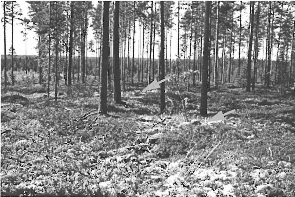
Kuva 2. Muhos Laitasaari Petäjäkangas. Näkymä kankaan laelta kohti etelä-lounasta. Etualalla rakenne B, taustalla rakenne A