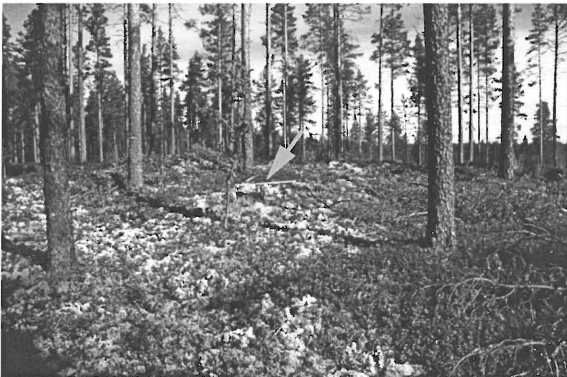
Kuva 4. Muhos Laitasaari Petäjäkangas. Röykkiö B. Kuvattu etelästä.