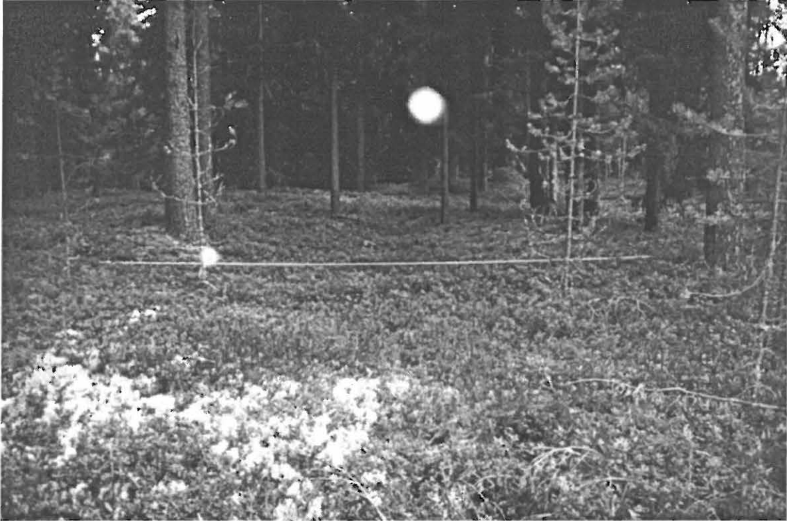
Kuva 3. Muhos Muhoskylä Pyhäkoski 4. Asuinpainanne 1. Kuvaussuunta 55/360° (Kuva: Janne Ikkäheimo. Oulun yliopisto, Arkeologian laboratorion dia 23572).