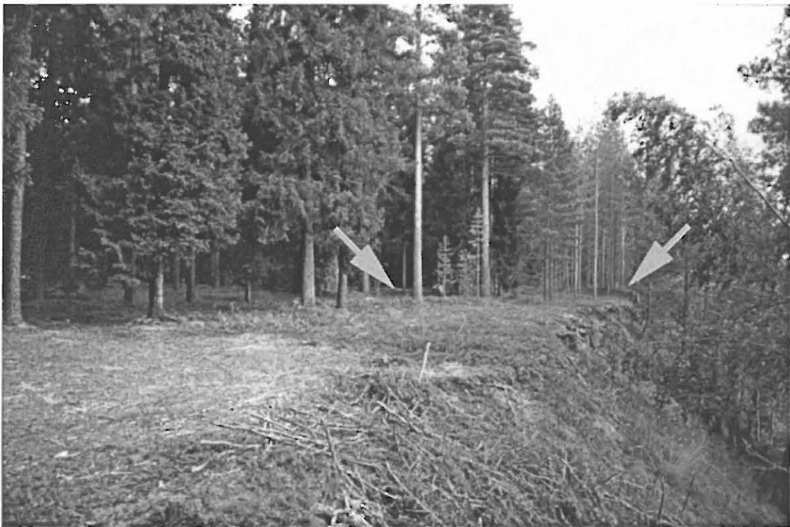
Kuva 2. Muhos Muhoskylä Pyhäkoski 4. Asuinpainannekohteen sijainti jokitörmän suhteen. Asuinpainanne 1 etualalla, asuinpaikkakuoppa 2 takaoikealla. Kuvaussuunta 50/360°.