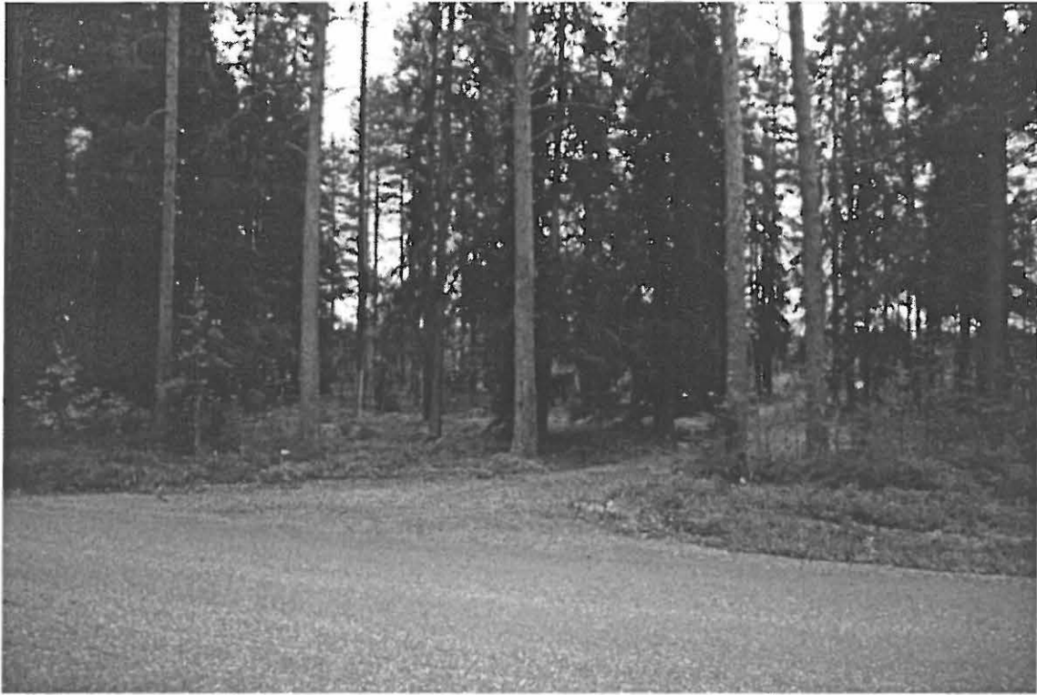
Kuva 1. Muhos Muhoskylä Pyhäkoski 4. Yleiskuva asuinpainannekohteesta Vaalantieltä käsin. Kuvaussuunta 140/360°.