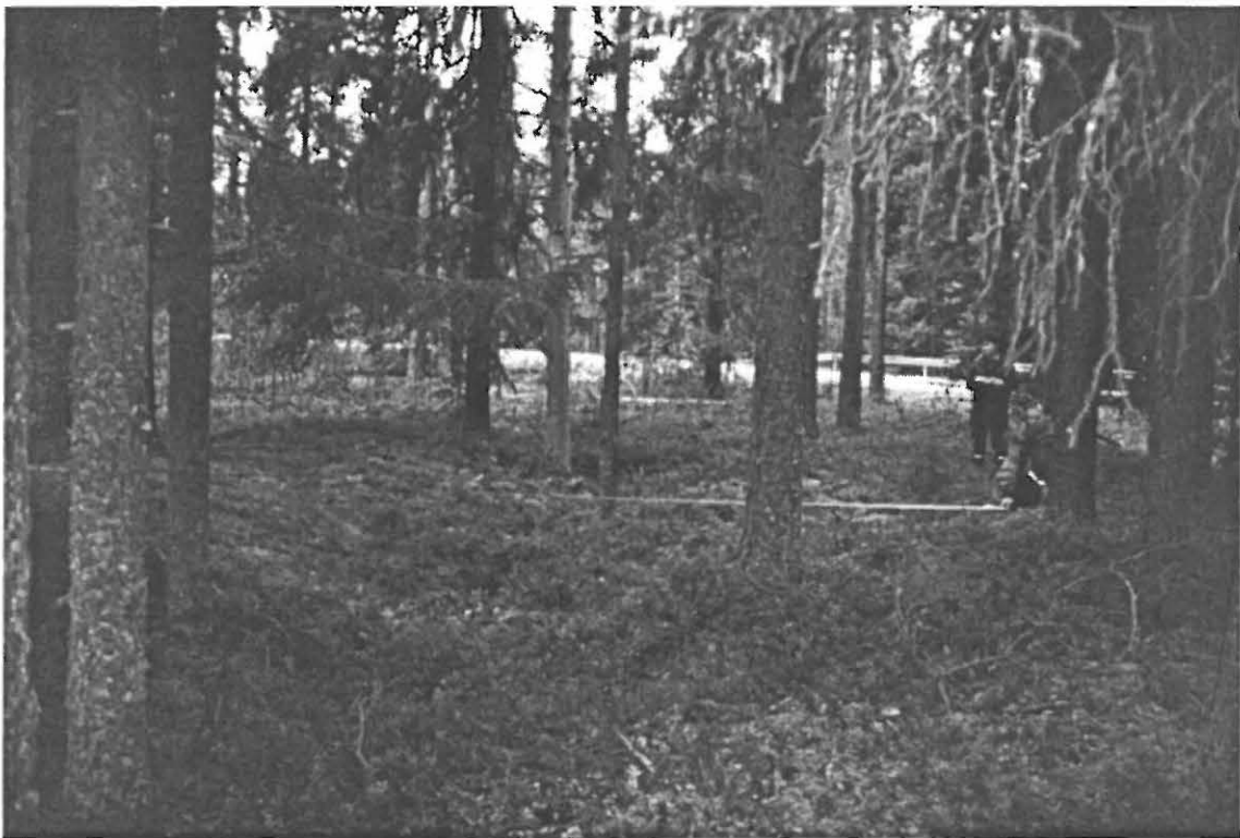
Kuva 4. Muhos Muhoskylä Pyhäkoski 4. Asuinpainanne 2. Kuvaussuunta 290/360° (Kuva: Janne Ikkäheimo. Oulun yliopisto, Arkeologian laboratorion dia 23573).